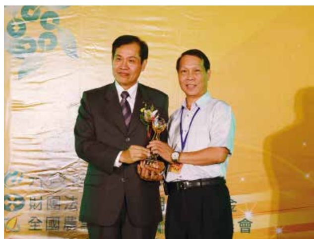
全國農業金庫陳董事長朝輝頒發「農業金庫策略合作獎」特優獎(得獎單位新北市板橋區農會)