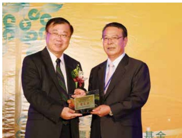
農委會陳主委保基頒發「營運卓越獎」乙組優等獎 (得獎單位臺中市大雅區農會)