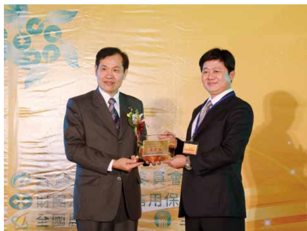
全國農業金庫陳董事長朝輝頒發「農業金庫策略合作獎」優等獎(得獎單位桃園市大園區農會)