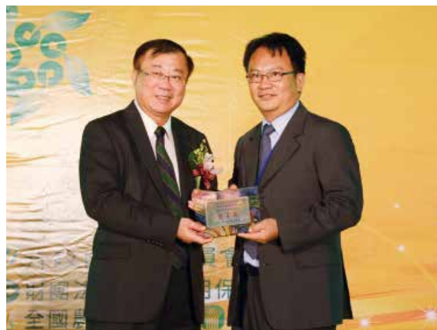
農委會陳主委保基頒發「營運卓越獎」丁組優等獎 (得獎單位花蓮縣吉安鄉農會)