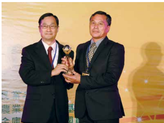
中央存保公司桂董事長先農頒發「重設信用部經營績效獎」特優獎(得獎單位新竹縣新豐鄉農會)