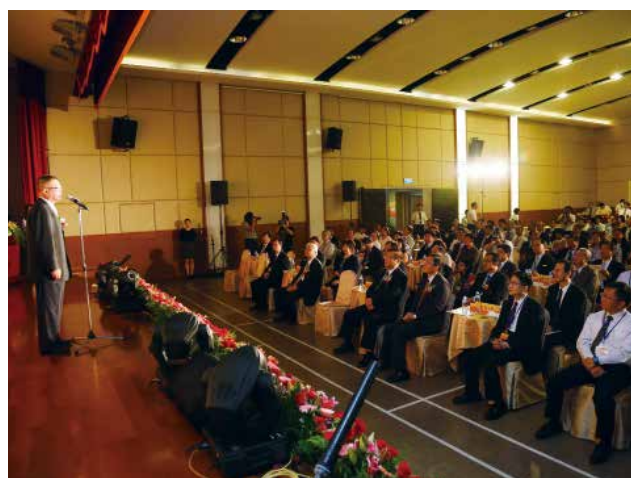
活動當日與會貴賓冠蓋雲集