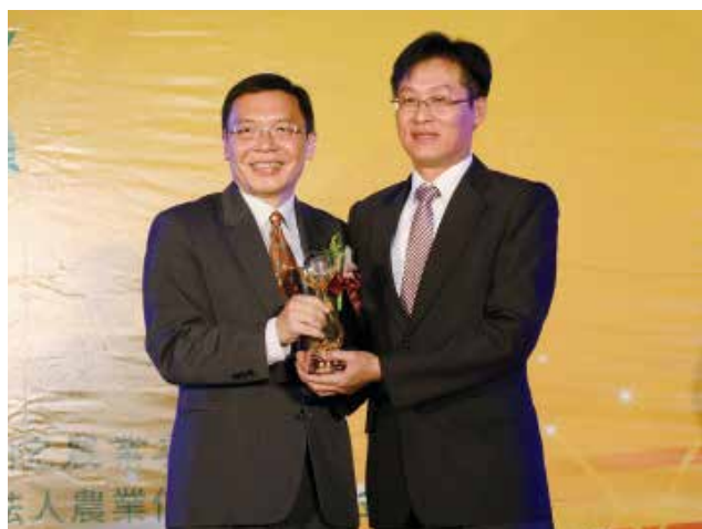
農業金融局許局長維文頒發「專案農貸績效獎」特優獎(得獎單位高雄市美濃區農會)