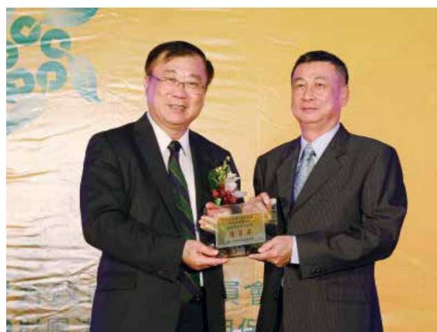
農委會陳主委保基頒發「營運卓越獎」戊組優等獎 (得獎單位屏東縣琉球區漁會)