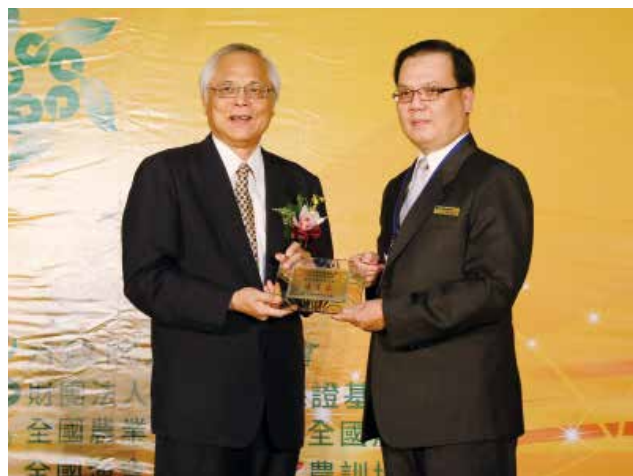
農委會陳副主任志清頒發「資產品質績優獎」優等獎 (得獎單位新北市蘆洲區農會)