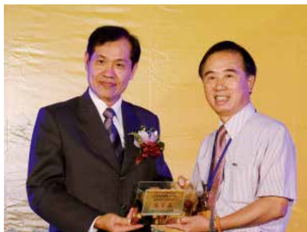
全國農業金庫陳董事長朝輝頒發「農業金庫策略合作獎」優等獎(得獎單位苗栗縣竹南鎮農會)