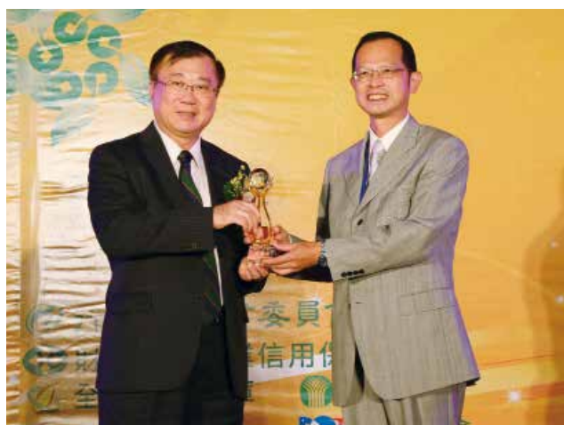
農委會陳主委保基頒發「營運卓越獎」乙組特優獎 (得獎單位新北市五股區農會)