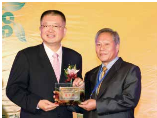
農業信用保證基金陳董事長杰頒發「農業信用保證業務績效獎」優等獎(得獎單位彰化縣彰化區漁會)