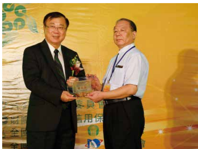
農委會陳主委保基頒發「營運卓越獎」甲組優等獎 (得獎單位新北市新莊區農會)