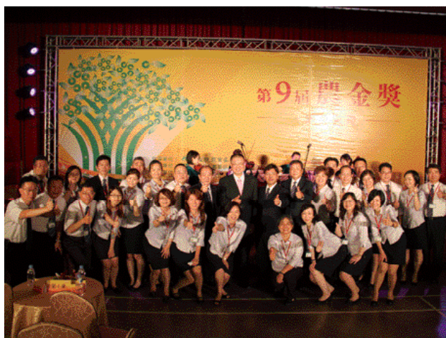
活動當日工作人員大合照