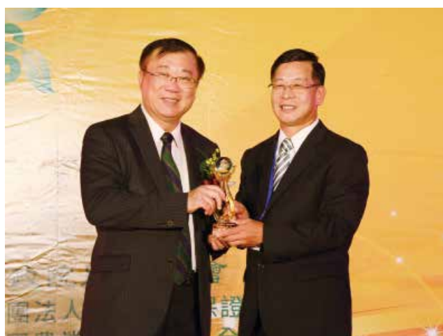
農委會陳主委保基頒發「營運卓越獎」戊組特優獎 (得獎單位新竹縣橫山地區農會)