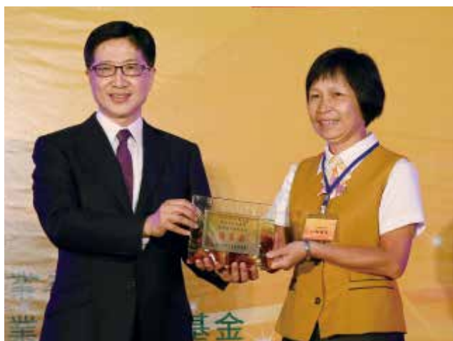
聯徵中心胡董事長富雄頒發「資產品質改善獎」優等獎(得獎單位彰化縣伸港鄉農會)