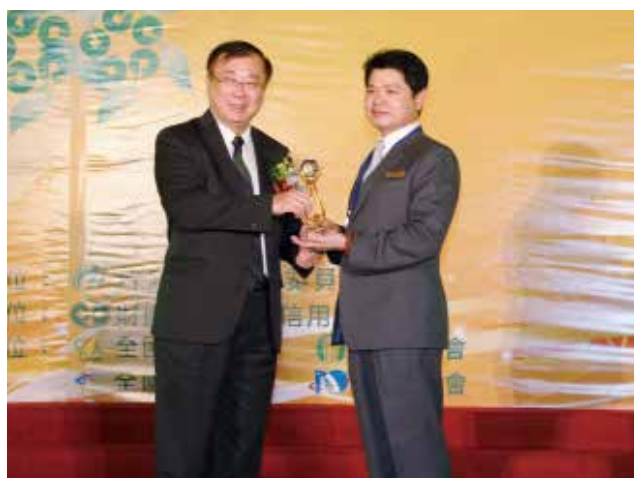
農委會陳主委保基頒發「營運卓越獎」甲組特優獎 (得獎單位新北市蘆洲區農會)