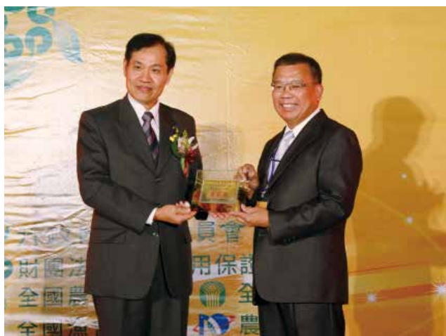
全國農業金庫陳董事長朝輝頒發「農業金庫策略合作獎」優等獎(得獎單位新北市淡水區農會)