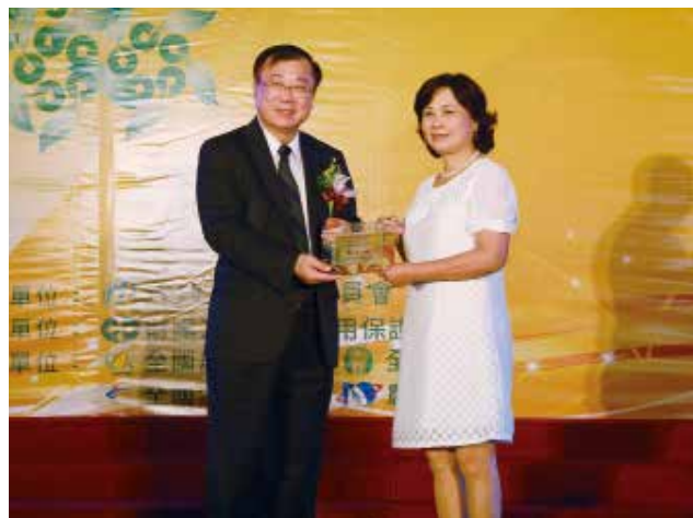
農委會陳主委保基頒發「營運卓越獎」丙組優等獎 (得獎單位宜蘭縣礁溪鄉農會)