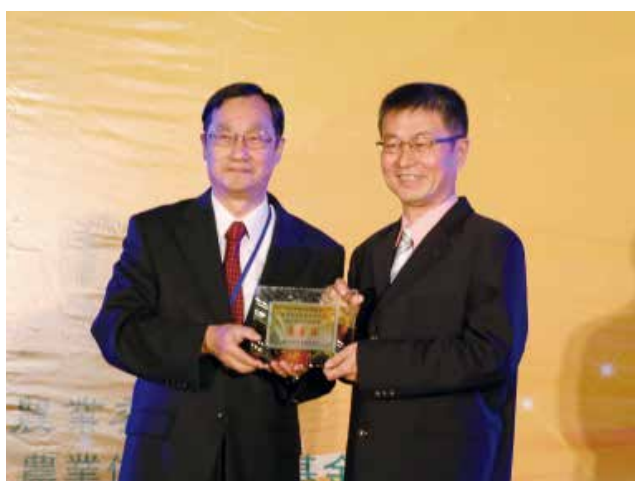
中央存保公司桂董事長先農頒發「重設信用部經營績效獎」優等獎(得獎單位雲林縣林內鄉農會)