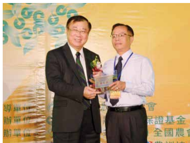
農委會陳主委保基頒發「營運卓越獎」乙組優等獎 (得獎單位宜蘭縣羅東鎮農會)