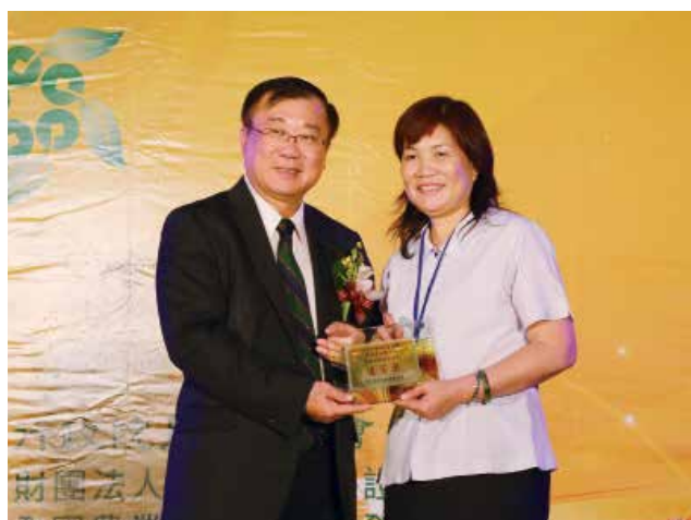
農委會陳主委保基頒發「營運卓越獎」丁組優等獎 (得獎單位苗栗縣後龍鎮農會)