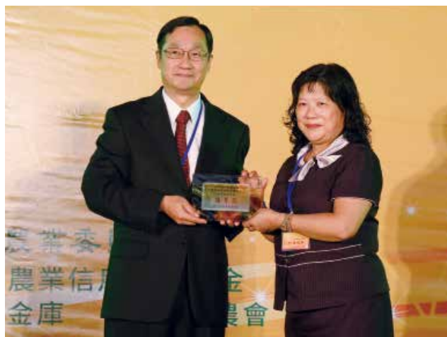
中央存保公司桂董事長先農頒發「重設信用部經營績效獎」優等獎(得獎單位中華民國農會)