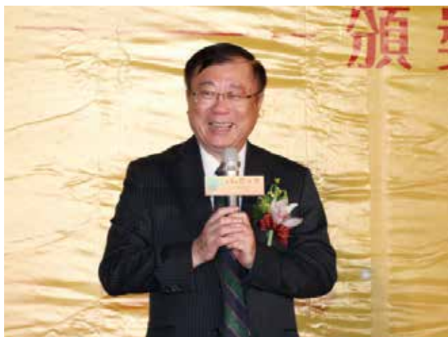
農委會陳主任委員保基致詞