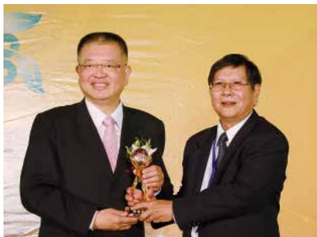
農業信用保證基金陳董事長杰頒發「農業信用保證業務績效獎」特優獎(得獎單位屏東縣東港區漁會)