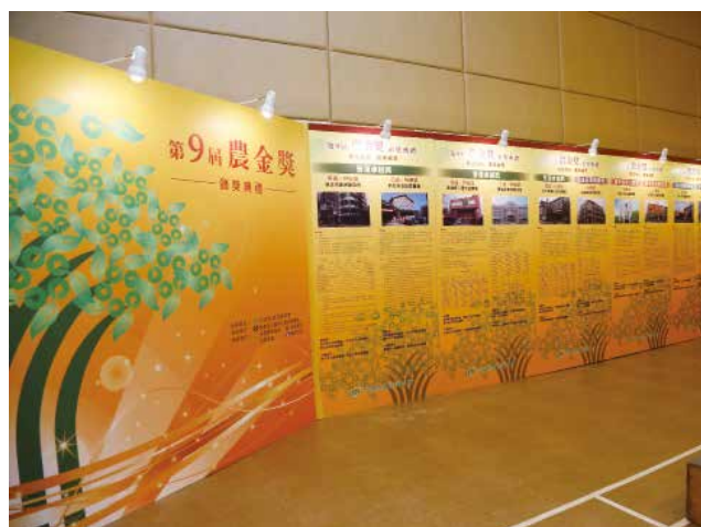
得獎單位事蹟簡介