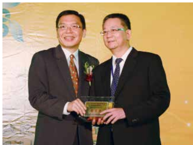
農業金融局許局長維文頒發「專案農貸績效獎」優等獎(得獎單位南投縣鹿谷鄉農會)