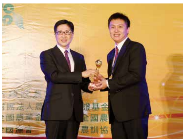
聯徵中心胡董事長富雄頒發「資產品質改善獎」特優獎(得獎單位臺北市南港區農會)