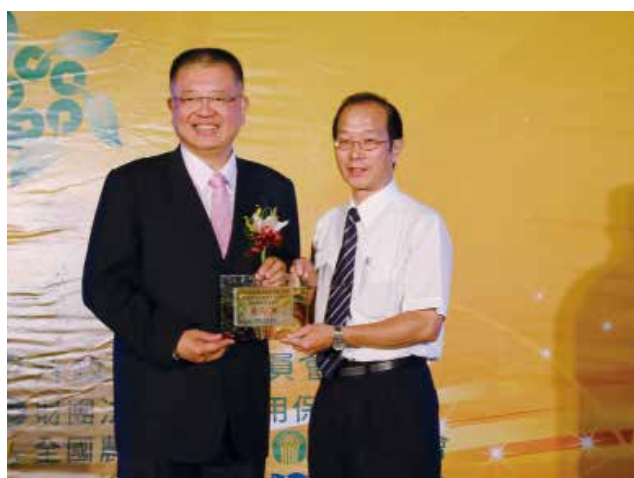
農業信用保證基金陳董事長杰頒發「農業信用保證業務績效獎」優等獎(得獎單位澎湖縣澎湖區漁會)