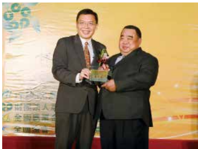
農業金融局許局長維文頒發「專案農貸績效獎」優等獎(得獎單位屏東縣里港鄉農會)