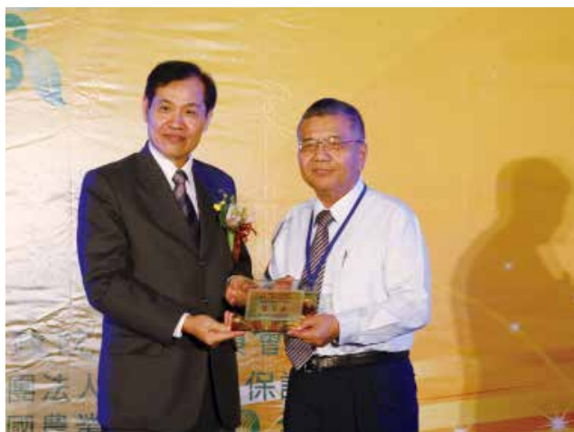
全國農業金庫陳董事長朝輝頒發「農業金庫策略合作獎」優等獎(得獎單位桃園市桃園區農會)