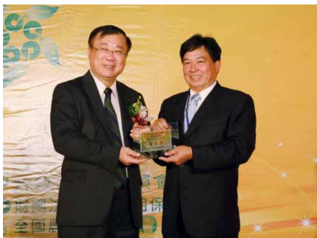
農委會陳主委保基頒發「營運卓越獎」戊組優等獎 (得獎單位花蓮縣光豐地區農會)