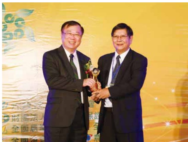
農委會陳主委保基頒發「營運卓越獎」丁組特優獎 (得獎單位屏東縣東港區漁會)