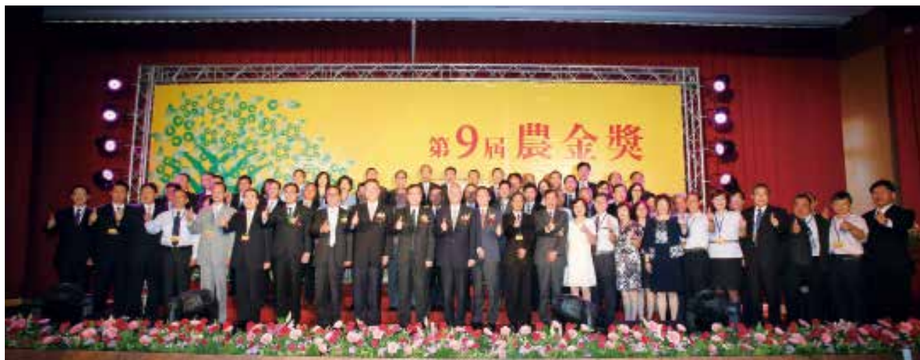
得獎單位代表及貴賓大合照