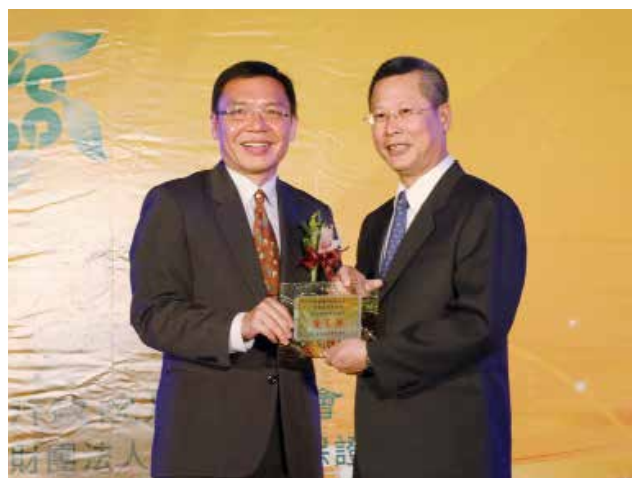
農業金融局許局長維文頒發「專案農貸績效獎」優等獎(得獎單位彰化縣埤頭鄉農會)