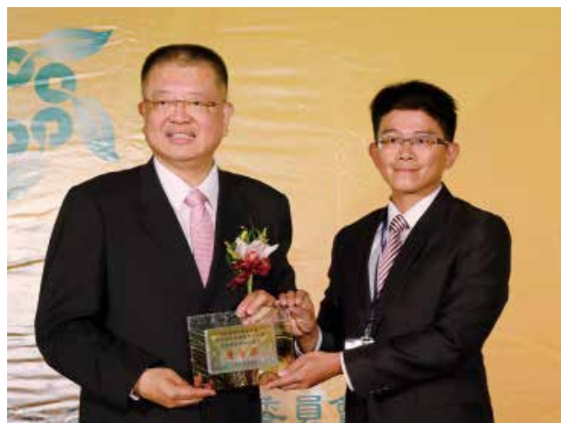
農業信用保證基金陳董事長杰頒發「農業信用保證業務績效獎」優等獎(得獎單位屏東縣枋寮地區農會)