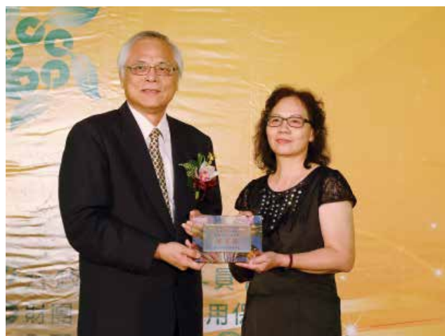
農委會陳副主任志清頒發「資產品質績優獎」優等獎 (得獎單位臺北市木柵區農會)