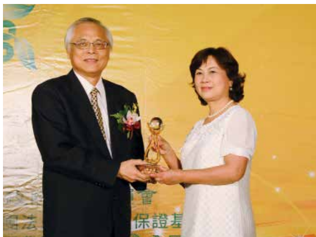
農委會陳副主任志清頒發「資產品質績優獎」特優獎 (得獎單位宜蘭縣礁溪鄉農會)