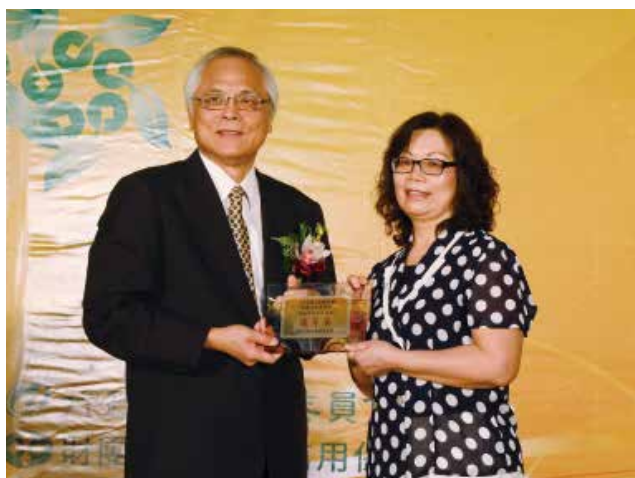
農委會陳副主任志清頒發「資產品質績優獎」優等獎 (得獎單位臺南市安定區農會)