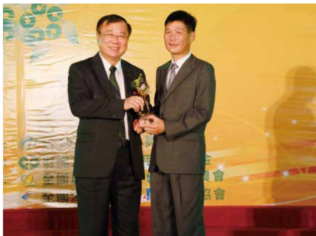
農委會陳主委保基頒發「營運卓越獎」丙組特優獎 (得獎單位宜蘭縣三星地區農會)