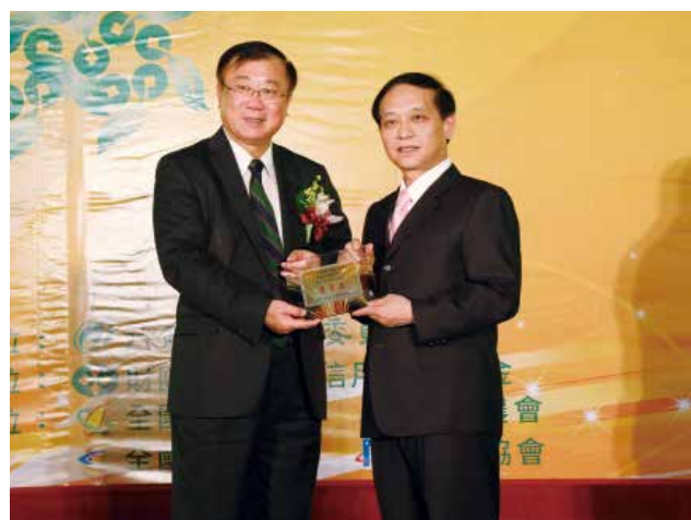
農委會陳主委保基頒發「營運卓越獎」甲組優等獎 (得獎單位新北市土城區農會)