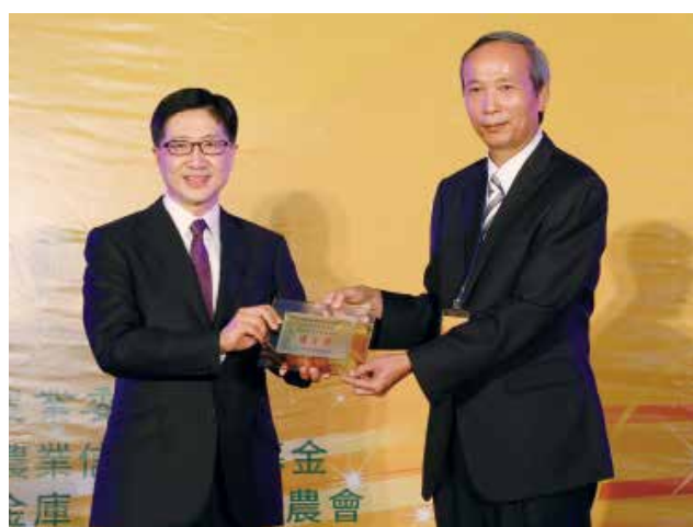
聯徵中心胡董事長富雄頒發「資產品質改善獎」優等獎(得獎單位新北市中和地區農會)