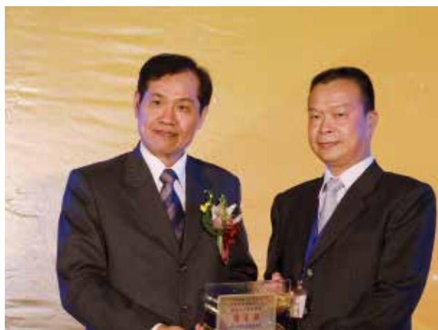
全國農業金庫陳董事長朝輝頒發「農業金庫策略合作獎」優等獎(得獎單位新北市三重區農會)