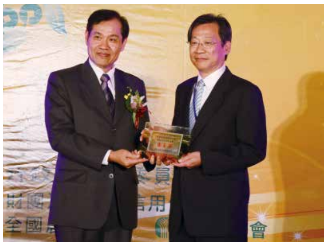
全國農業金庫陳董事長朝輝頒發「農業金庫策略合作獎」優等獎(得獎單位新北市汐止區農會)