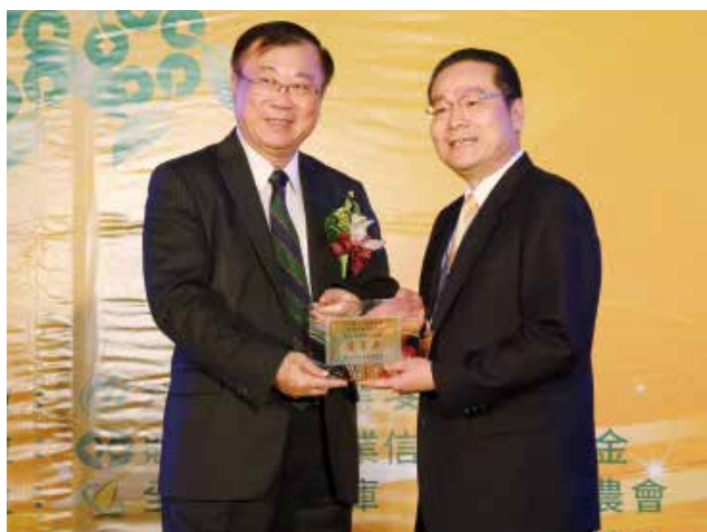
農委會陳主委保基頒發「營運卓越獎」乙組優等獎 (得獎單位新北市鶯歌區農會)