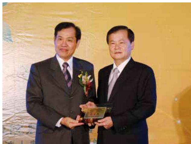
全國農業金庫陳董事長朝輝頒發「農業金庫策略合作獎」優等獎(得獎單位臺中市大里區農會)