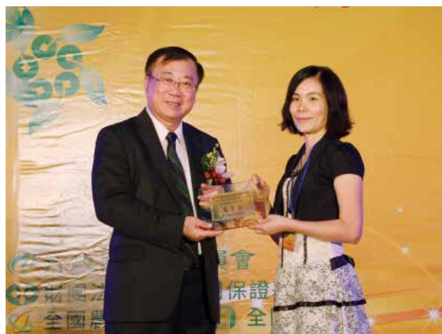
農委會陳主委保基頒發「營運卓越獎」戊組優等獎 (得獎單位臺東縣關山鎮農會)