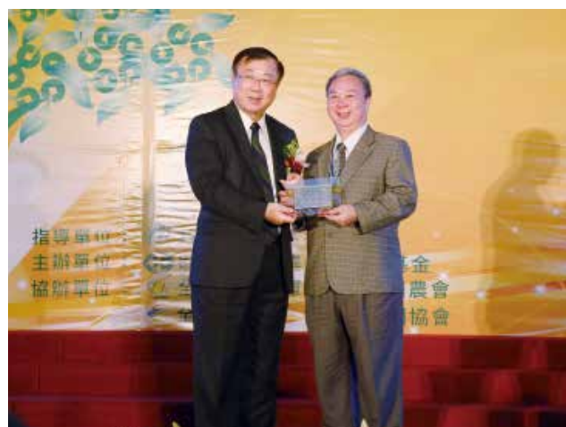
農委會陳主委保基頒發「營運卓越獎」甲組優等獎 (得獎單位新北市汐止區農會)