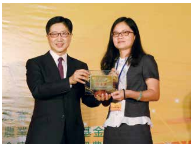
聯徵中心胡董事長富雄頒發「資產品質改善獎」優等獎(得獎單位苗栗縣通苑區漁會)