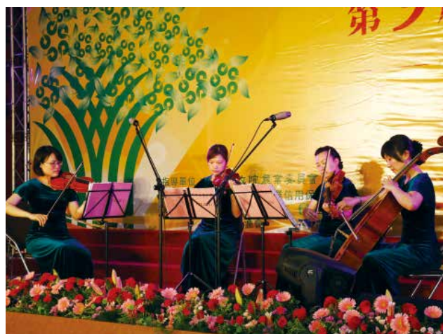
長榮交響樂團演出