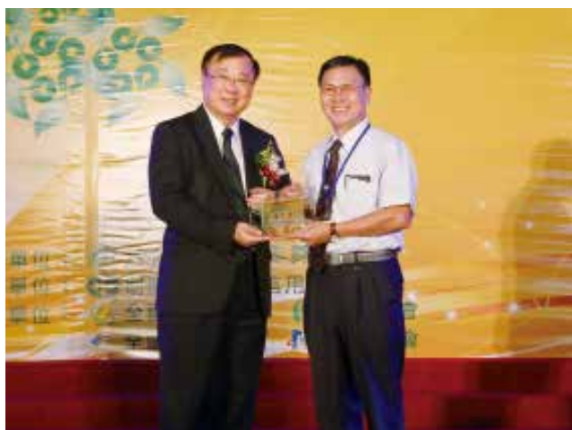
農委會陳主委保基頒發「營運卓越獎」丙組優等獎 (得獎單位臺南市安定區農會)