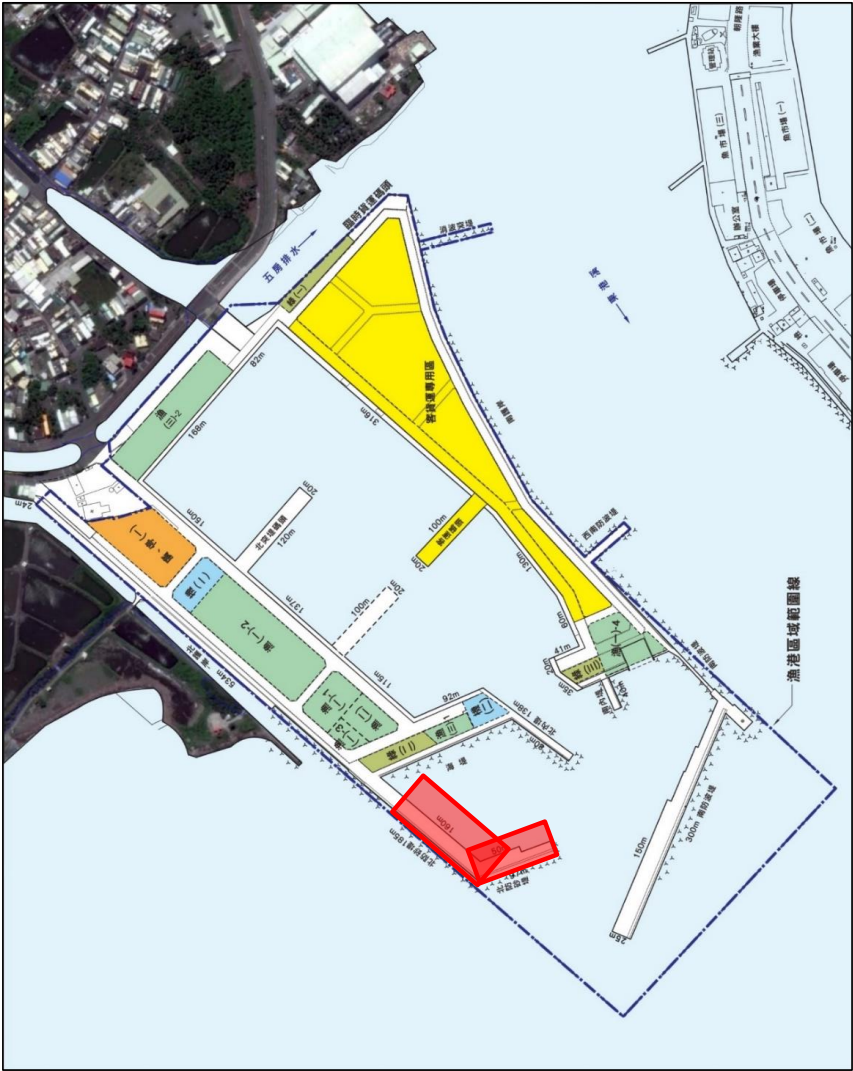
活魚運搬船泊限定碼頭區域