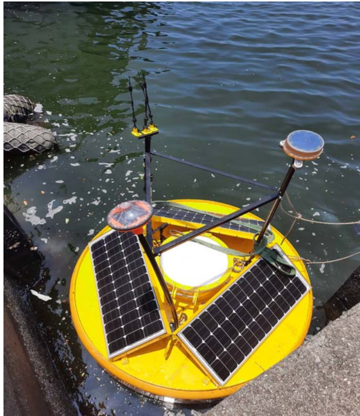
直徑 2 公尺水位浮標外觀