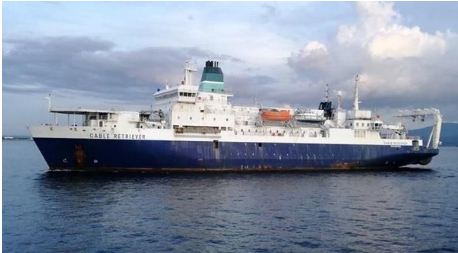
圖一：Cable Retriever 號左舷照片