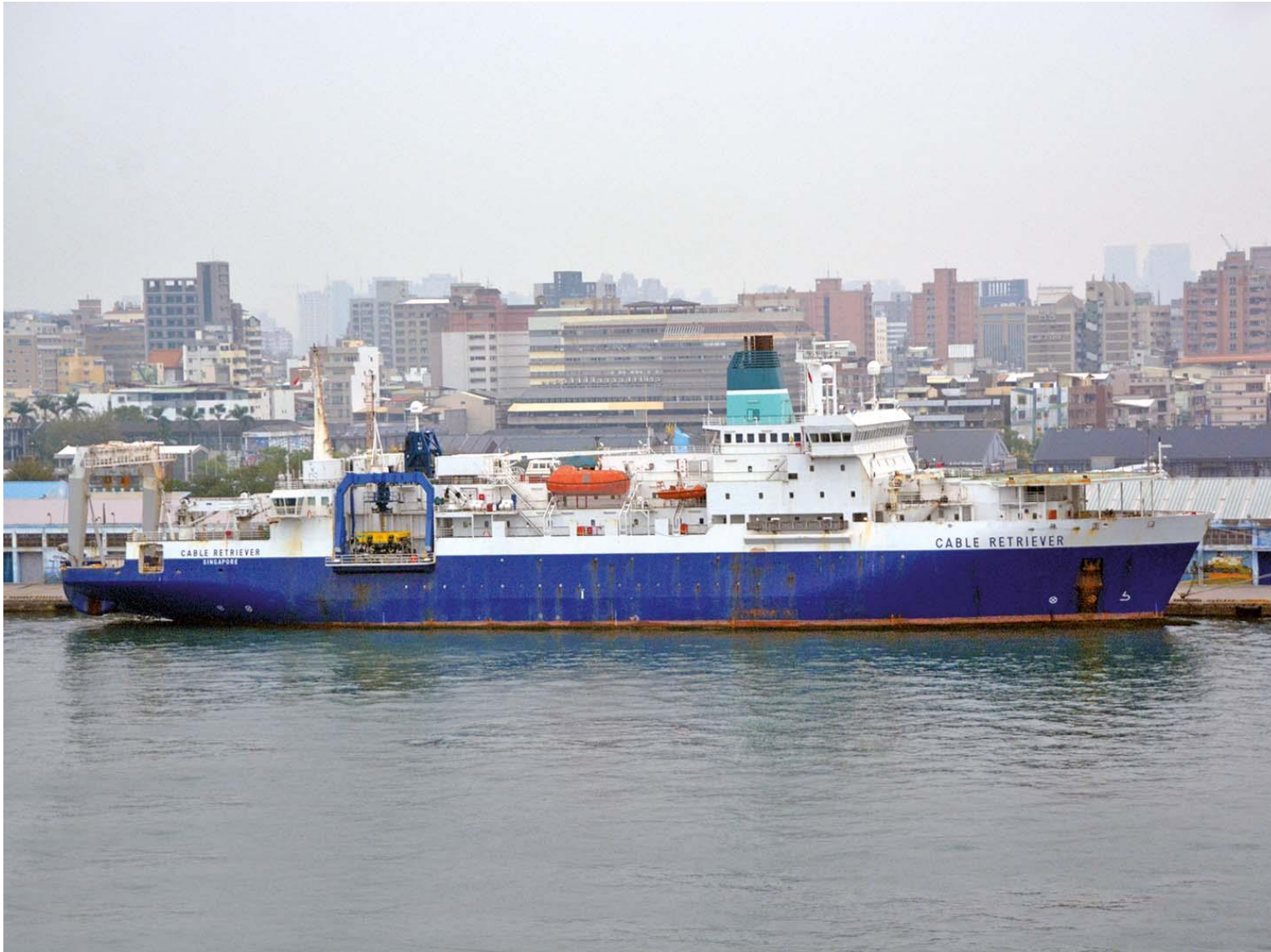
圖二：Cable Retriever 號右舷照片