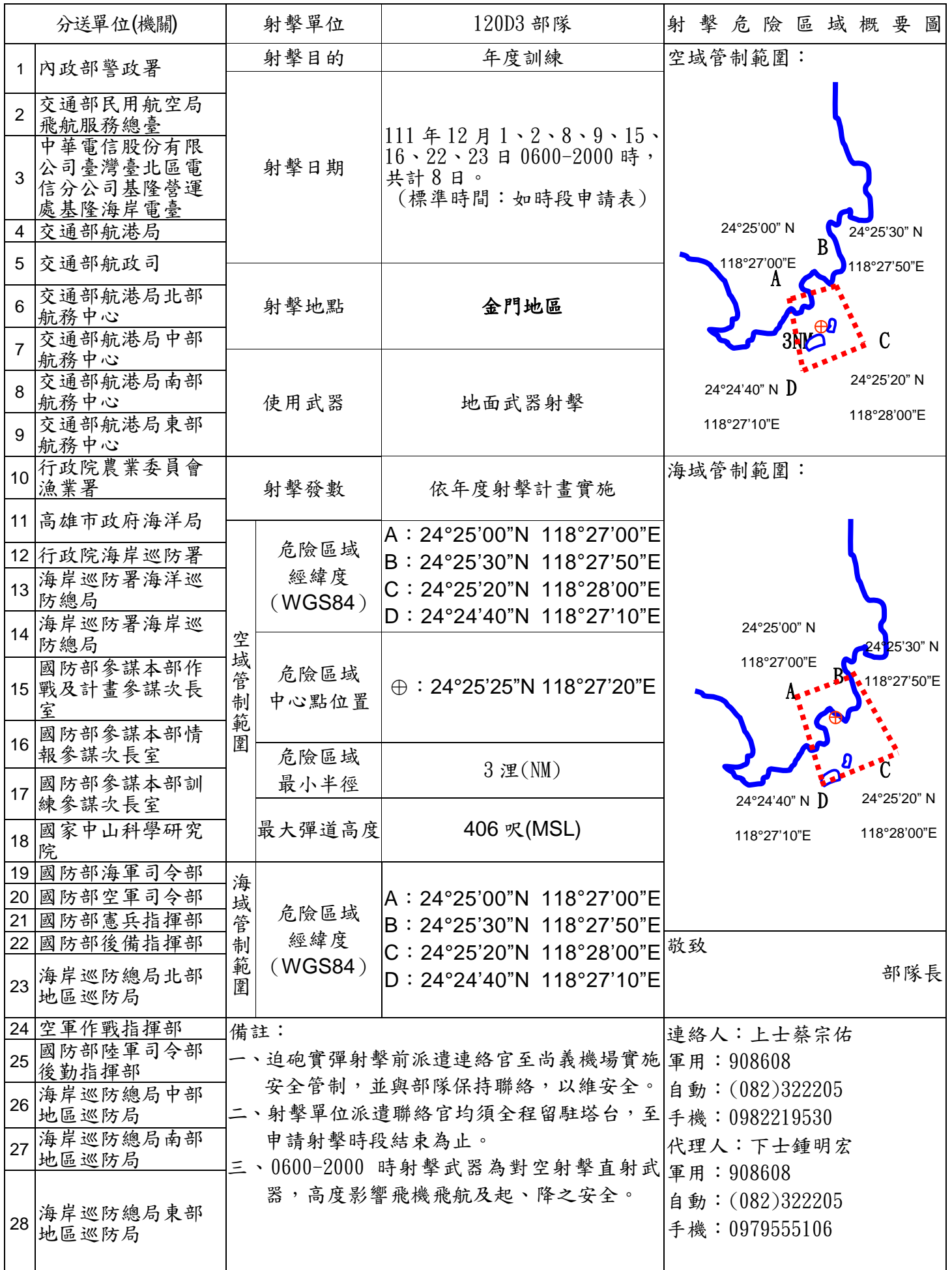
120D3 部隊對海（空）實彈射擊報告單