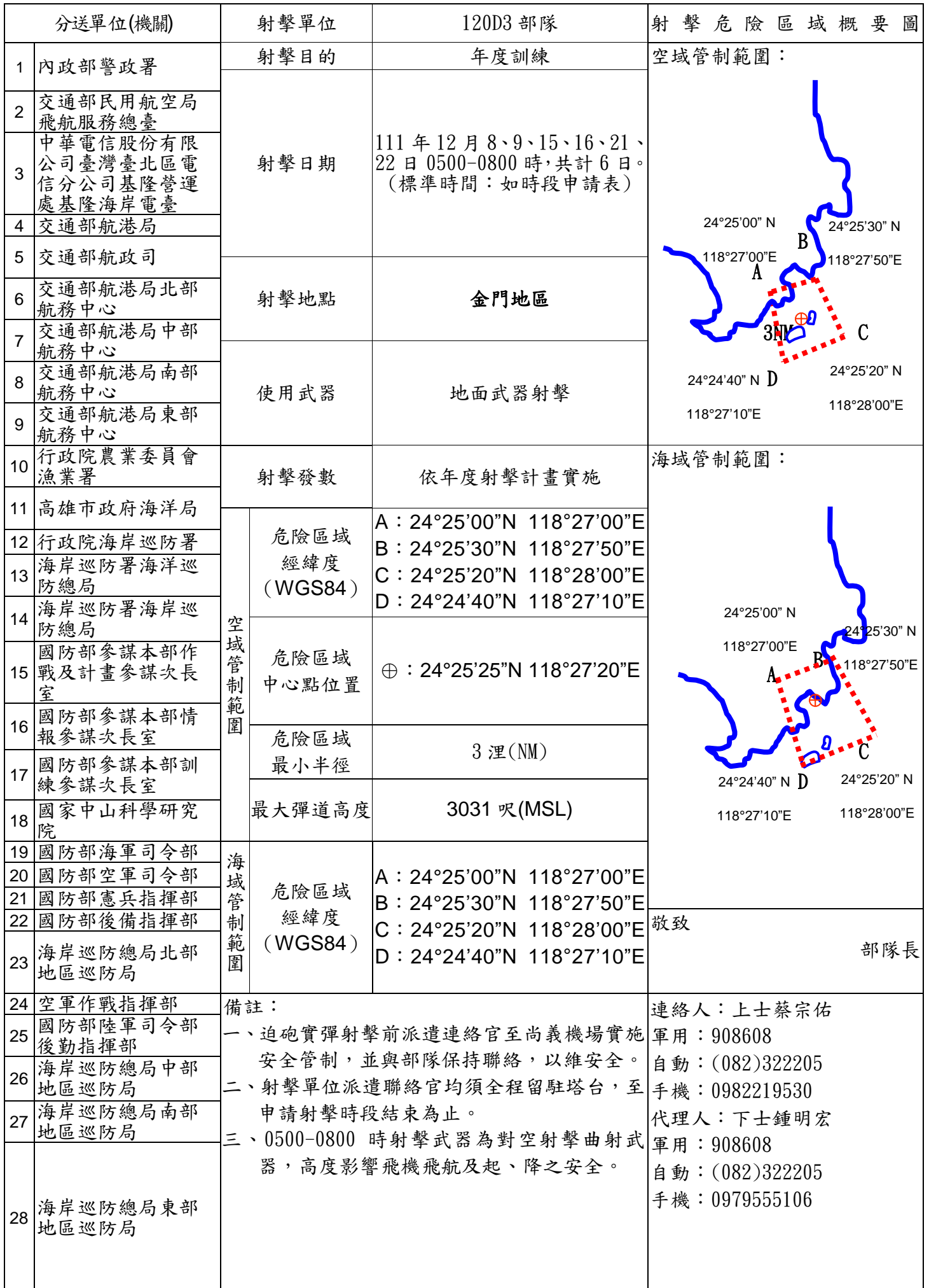
120D3 部隊對海（空）實彈射擊報告單