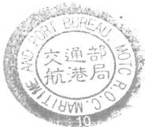
表-5 長安7號平台船船籍