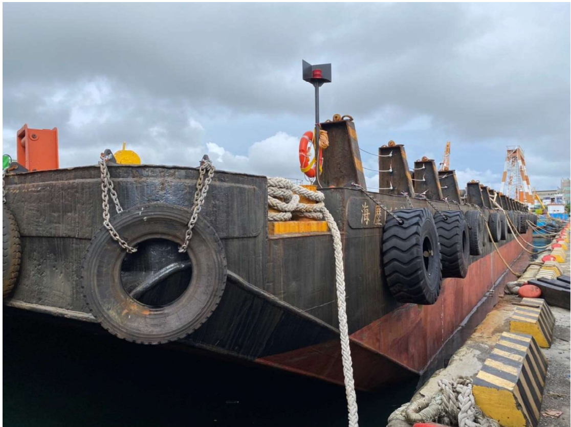
圖 5 海歷 149 號外觀現況