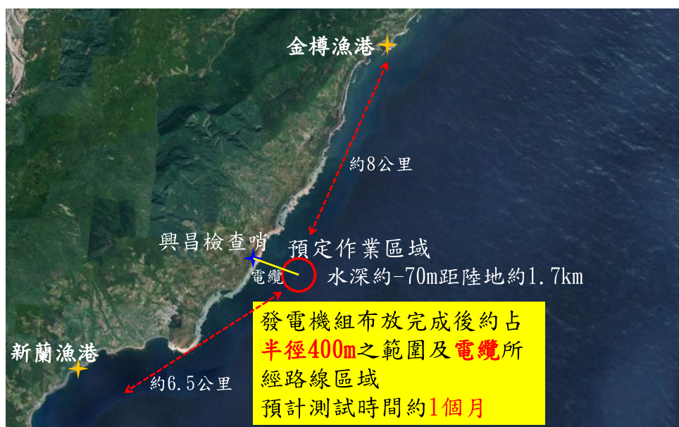
圖 1 洋流發電海纜鋪設工程預定作業範圍略圖

本計畫海纜鋪設作業範圍為台東縣東河鄉金樽漁港東南方海域之興昌檢查哨至外海水深約-70m 水深處，主要針對 20kw 發電機組系統及錨碇系統，於作業海域進行布放及回收之海事工程。計畫工作範圍如圖 1 所示。