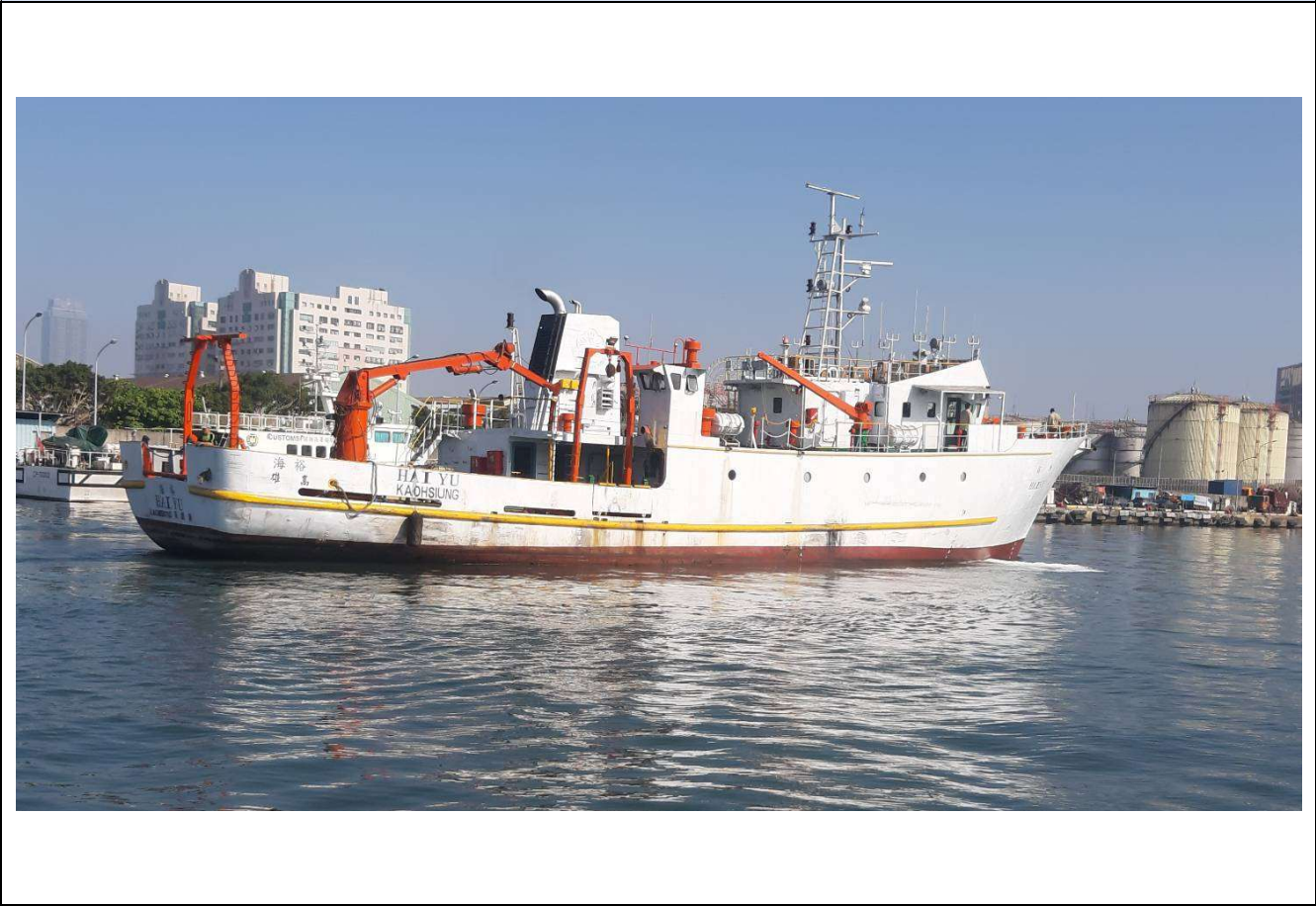
船的照片 Vessel Photo