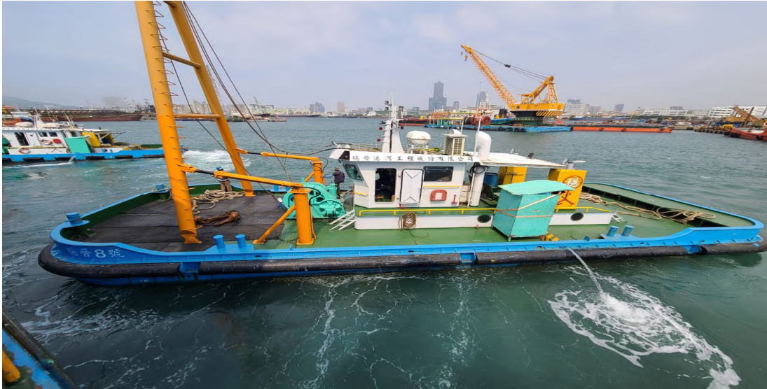
圖 10：穩晉 8 號左舷相片