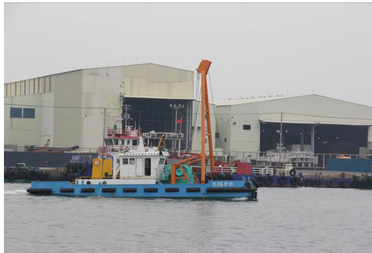
圖 17：穩晉 16 號右舷相片