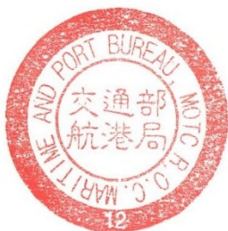
圖 15：穩晉 13 號國籍證書