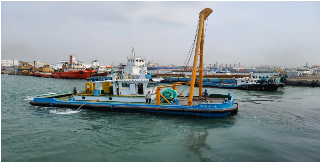
圖 11：穩晉 8 號右舷相片