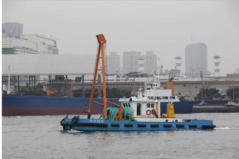
圖 16：穩晉 16 號左舷相片