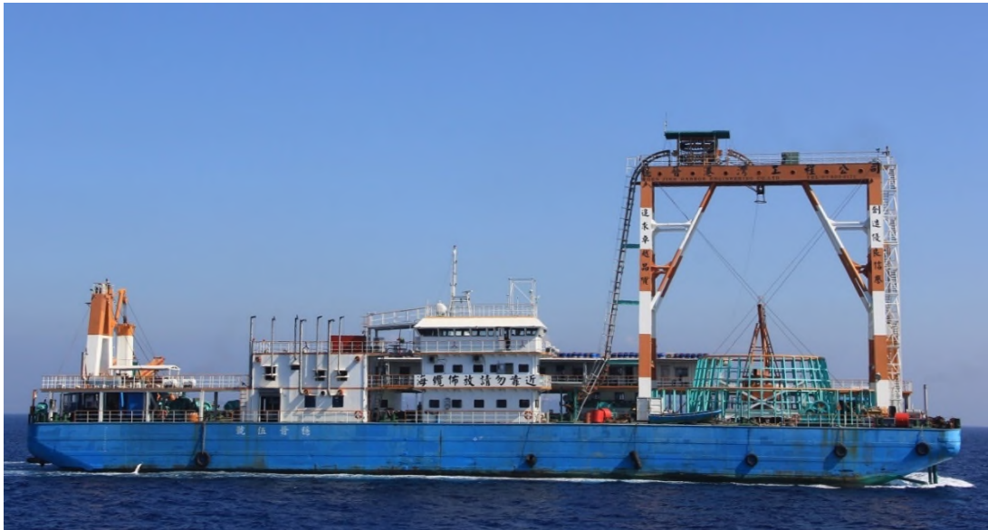
圖 5：穩晉 5 號右舷相片