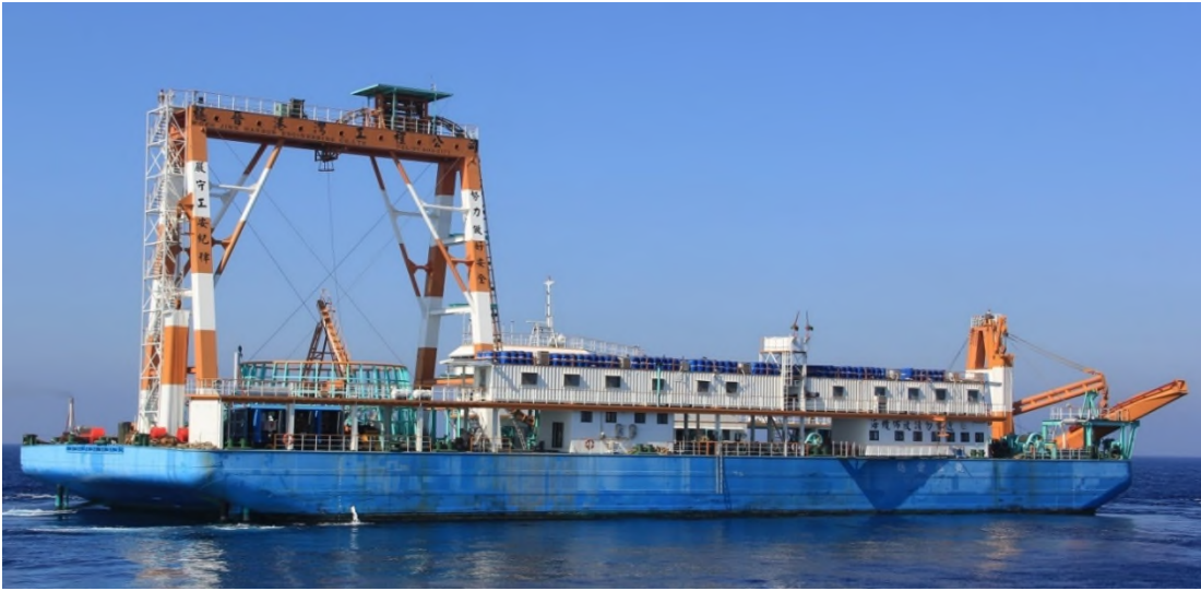
圖 4：穩晉 5 號左舷相片