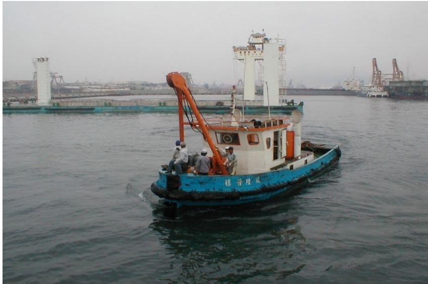
圖 7：穩晉 6 號左舷相片