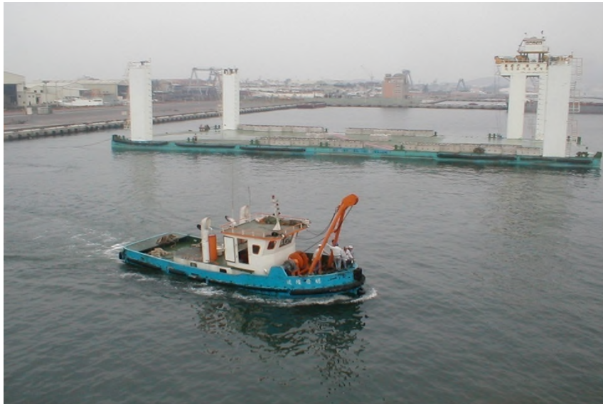
圖 8：穩晉 6 號右舷相片