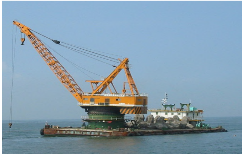
圖 13：穩晉 13 號左舷相片