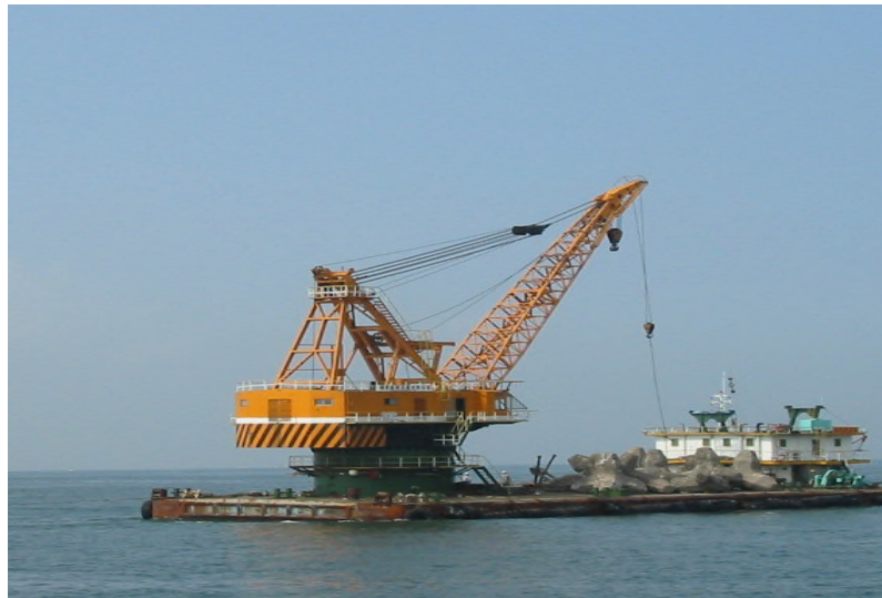
圖 14：穩晉 13 號右舷相片