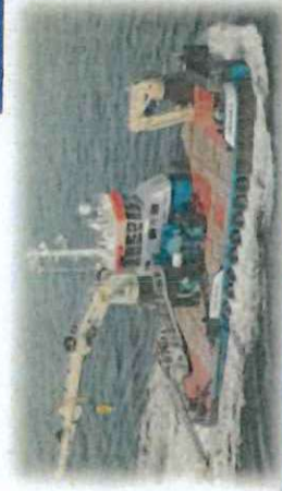
輔助甲板減壓艙供潛水人員使用之拖船Zwerver II