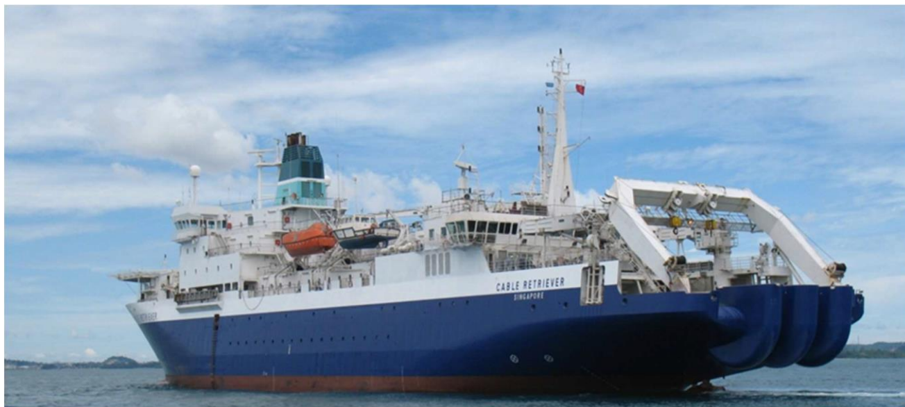
Cable Retriever 海纜船