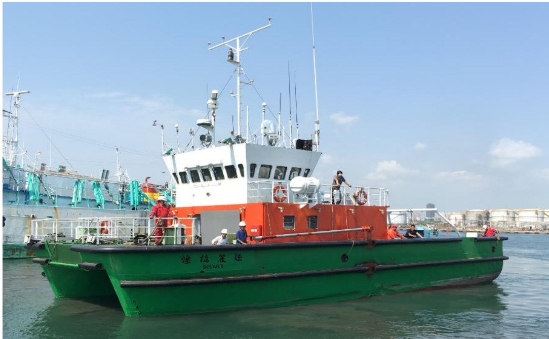
圖 3 燦拉麗絲號 船舶照片