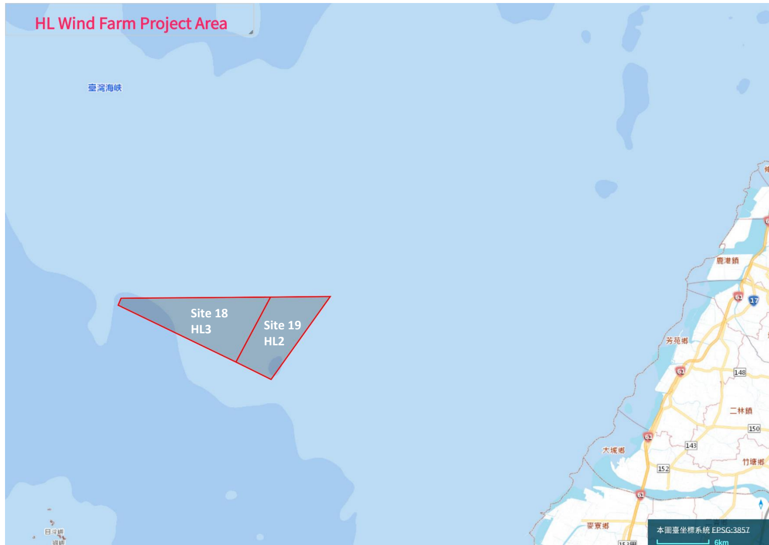
圖 1 海龍二號與海龍三號離岸風場位置示意圖