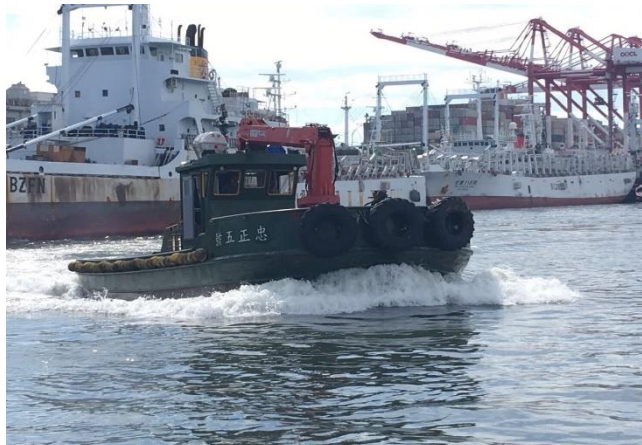
忠正 5 號