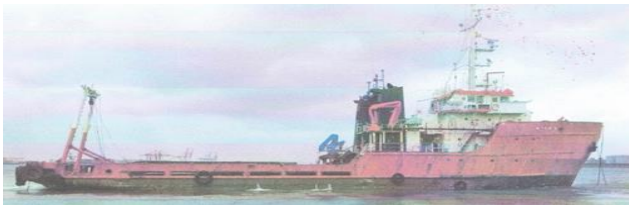
大瀚 9 號照片