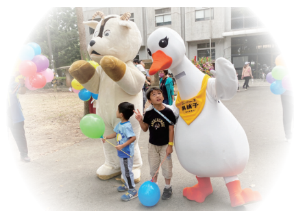
模特鵝及羊肉爐出場照／嚴秀華 提供（111/12/04） 開放日全體同仁合影／馬和濱 提供（111/12/04）