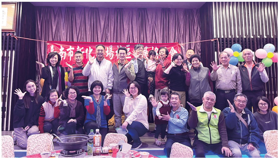
牧場社區尾牙摸彩暨會員大會合影（111/12/21）