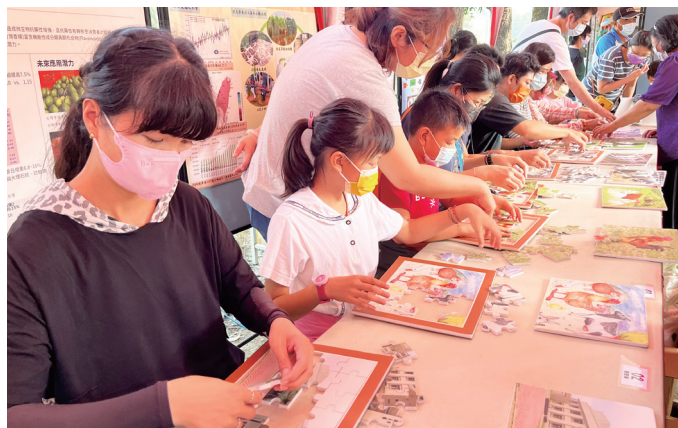
本組攤位益智遊戲實況／林幼君 提供（111/12/04）