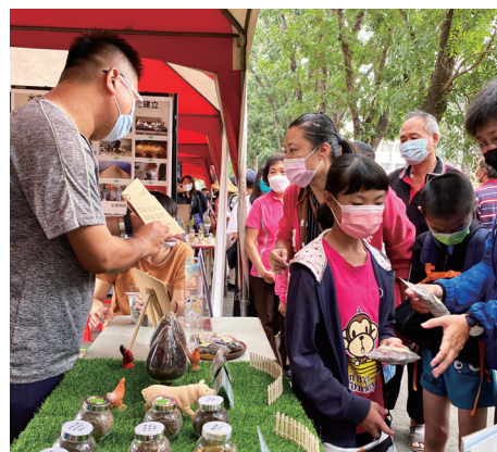
限時限量的「有獎徵答送好粒」活動／劉威志 提供（111/12/04）

「2050 淨零排放」。當日展示內容包含本組農牧循環與淨零減碳效益、雞糞造粒相關製作流程以及沼氣增量技術、產業組一股以副產物餵飼反芻動物及黑水虻綠循環，以及宜蘭分所水禽廢水資源化循環生產模式之建立等，分別以海報、實體展品及影片連續播放的方式呈現。此外，除了介紹研究成果外，同時為增進與現場民眾互動，亦規劃限時限量的「有獎徵答送好粒」的活動，好粒即是近年來受產業界矚目的「5-08 雞糞加工肥料」。如此接地氣的獎品，當然受到熱烈迴響。當日民眾大排長龍，期待能獲得粒狀雞糞肥料外，同時也學到了畜產小知識呢！