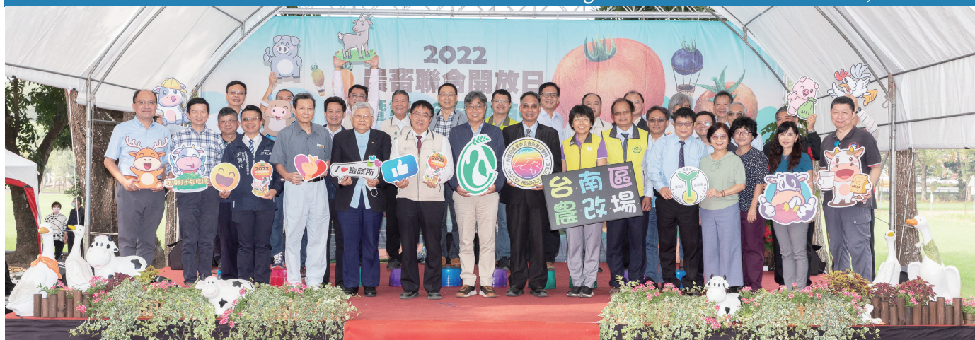
農畜聯合開放日參與貴賓大合影（前排左4起為農委會王政騰前副主委、中研院周昌弘院士、臺南市黃偉哲市長、農委會陳駿季副主委、本所黃振芳所長、臺南區農業改良場楊宏瑛場長、種苗改進協會施任青理事長、農委會科技處王仕賢處長及臺中農業改良場李紅曦場長）／陳閔聰 提供（111/12/04）