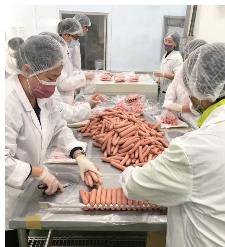
肉品工廠內同仁辛勤工作場景／林美蓉 提供（111/12/27）

然而在加工組同仁全體通力合作，克服萬難，於減員嚴重下仍依進度完成既定目標。本次春節肉製品製作採購原料肉約一萬五千公斤，生產臘肉、香腸、貢丸及熱狗等產品，共計約三萬包，於 112 年 1 月 11 日發放大夥期待已久的「年貨」。