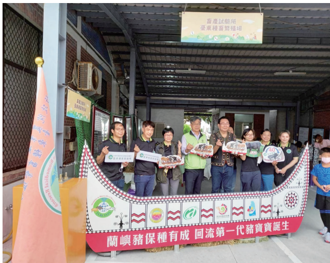
農委會陳駿季副主委（左 4）現身「夯食農 原力現」開放日活動與本場同仁合影（111/11/05）

臺東區農業改良場於 111 年 11 月 5 日舉辦「夯食農 原力現」開放日活動，本場共襄盛舉，今年以「原豬原味，貢襄盛舉」為展覽主題。活動前一天，同仁齊心協力進行會場布置，活動展出從規畫、海報製作、成果展示及民眾互動等著實花了不少心思，期盼以豐富有趣方式呈現，藉此與民眾互動，輔以相關成果宣導。活動當日早上 9 點正式開跑，一早便吸引大批人潮湧入，同仁熱情為民眾進行詳細解說，讓社會大眾認識臺灣本土蘭嶼豬之價值與貢獻。為了更貼近參觀人潮，同仁們在後臺準備蘭嶼豬肉製品，藉此分享原鄉特色產品，原味貢丸口感