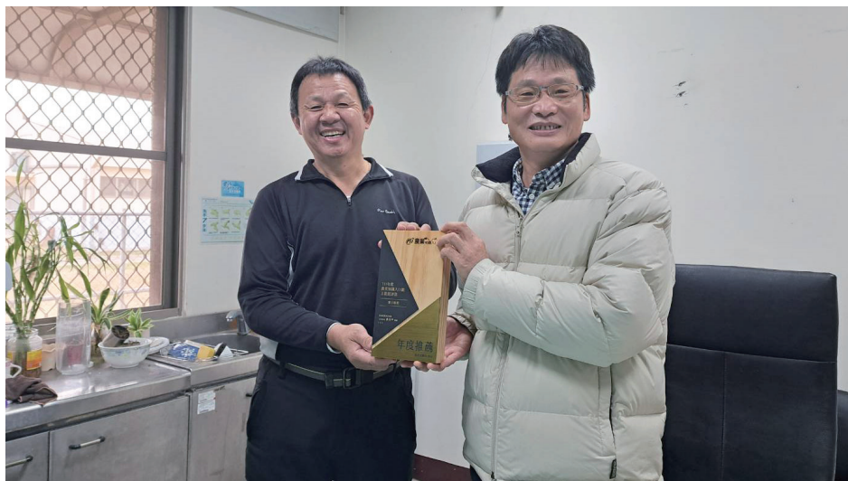
111 年度農業知識入口網推薦獎座／李佳蓉 提供（111/12/29）