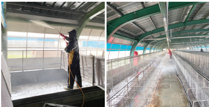
宜蘭分所同仁清洗鴨舍內部情形／林雅玲 提供（111/12/30）

本分所因疫情，經管鴨隻、飼料及鴨蛋於 111 年 11 月 20 日配合宜蘭縣動植物防疫所執行防疫處置。為早日達到復養條件，恢復鴨隻試驗及推廣業務，自防疫處置後每日持續進行飼養區的清消作業。清消的工作量不亞於先前飼養數千隻鴨群的時候，分所內全體動員進行鴨舍的環境清潔整理。為保護同仁健康及確保生物安全，過程皆需穿戴完整