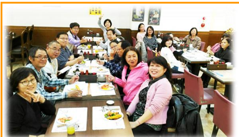
技術服務組全組同仁同聚歡慶尾牙

1 月 25 日下班後，全組同仁，除了支援農委會南向辦公室的萬博士之外，一位不缺的全員到齊，享受～點主食即有沙拉吧、水果、熟食、糕點、冰品吃到飽的年終尾牙盛宴！同仁們事先點好的排餐一一上菜，就算是素食的同仁也有不少菜餚是可以吃的，真是