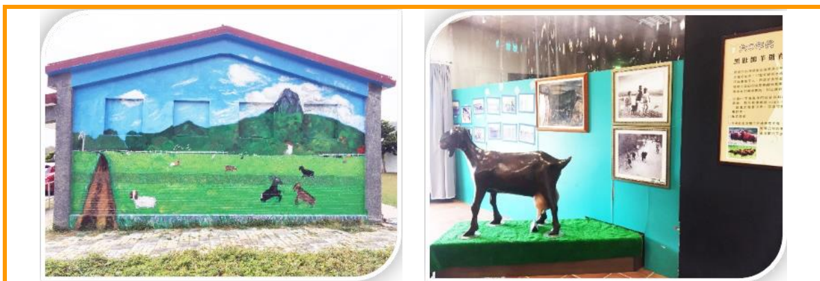
恆春分所員工消費合作社/曾楷扉 提供

新的一年，新的開始，恆春分所（墾丁牧場）合作社雖在去年遭遇祝融之災，但在各方引頸期盼下，再次重新開幕，而且越挫越勇，不單單只是恢復原有風貌，重現往日回憶中的招牌美食，更展開新的經營方針，以增加本分所特色產品多元化，如鮮羊乳、鮮羊乳凍、苜蓿牛軋糖等，為日後努力方向，並期望可與本所各分場所合作，將各地特色研究產品商品化，藉由墾丁牧場合作社的知名度與極佳的地理位置，發展精緻化畜產品，推廣臺灣在地化優良好商品，同時增進畜產改良作業基金運轉，以期增加本所及畜產品的宣傳效果，朝向產業示範商店發展。