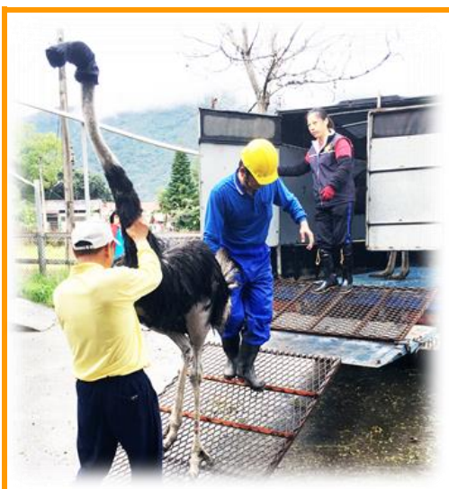
來～來～來～直直退～

去年年底參加了駝鳥協會大會，因而認識了彰化的尤先生，他對本場駝鳥極有興趣，在多次聯繫下，於 1 月 19 日到本場買駝鳥，並現場分享了一些飼養秘訣給我們，原來矇住駝鳥雙眼後，一人輕抓尾巴往後退，而另一人輕推脖子和胸，駝鳥便會乖乖地後退走上車啦～實在是很神奇啊！學到這妙招後，大大提升了咱們的現場驅趕作業安全性及大幅縮短了操作時間，既減少駝鳥的緊迫也減少人員體力的消耗，一舉兩得啊！此外，尤先生對於本場成長期的駝鳥讚譽有加，看來本場的駝鳥飼養管理頗有成效。