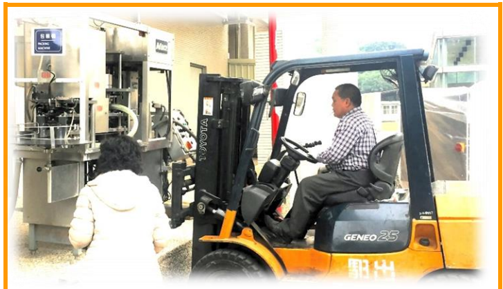
乳品加工廠舊包裝機之遷出

鮮乳製作所使用之均質機、板式殺菌、包裝機及相關管路皆已使用多年，但在同仁專業的保養下，各項設備運作尚稱順暢。所內鮮奶包裝機需要人工輔助裝瓶，相較於其它設備，包裝機與現場工作人員接觸較頻繁，機器運轉誤傷人員之風險稍高。此外，舊包裝機由於老舊，偶有封裝不當、產品洩漏的問題。為了人員操作安全及改善產品品質，本組於 106 年 12 月引進一台新的包裝機來取代舊包裝機。