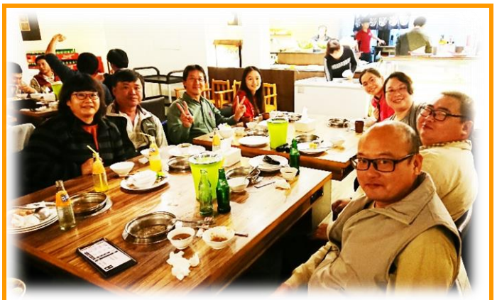
澎湖工作站尾牙聚餐

本次聚會選擇吃到飽火鍋餐廳，同仁們可就各自的喜好選擇火鍋湯底，無限量供應的肉類、蔬菜及火鍋料，更讓人垂涎三尺、食慾大開，在等待其他同仁的同時筆者已虎視眈眈盯著吧檯上的食材，心中盤算著「作戰策略」，待全員到齊主任宣布開動後，大夥便磨刀霍霍往吧檯移動，餐敘過程中同仁們一邊品嚐著鍋物料理一邊聊著工作與生活的瑣事，愉悅的心情在臉上展露無遺，本次尾牙就在主任對大夥的勉勵期許與大合照中劃下句點，新的一年，加油！