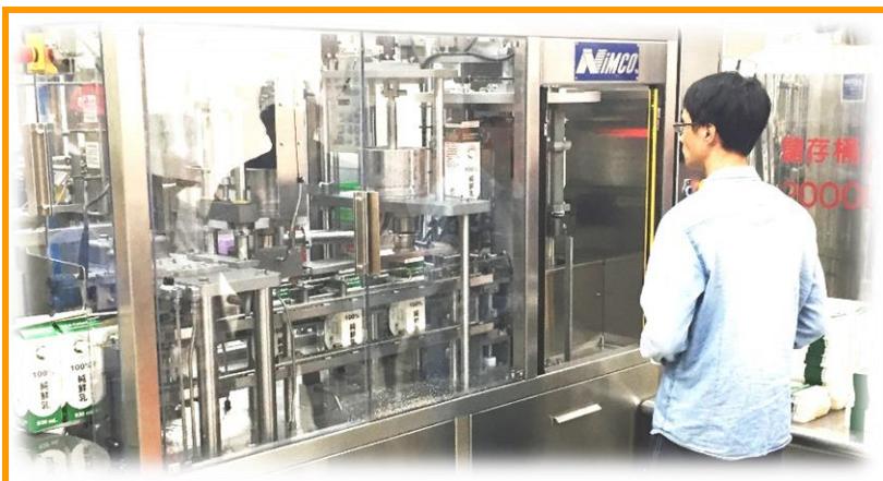
乳品加工廠新包裝機運轉調整

啟門板或是裝瓶順序不當，皆會自動停機以保護人員及設備。但也因為如此，此機器之人工輔助裝瓶熟練度需求較高，筆者裝瓶曾經誤觸安全保護機制，導致自動停機，不過隨著多次練習，目前鮮乳生產愈來愈順利了。一開始鮮乳包裝有部分封裝不良、日期模糊的問題，但在廠商及同仁多次調整努力下，封瓶的完整性及製造日期清晰度越來越好。