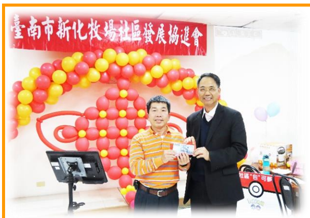
產業組簡明全大哥(左1)榮獲年終晚會最大獎，好運一整年

今年度的年終晚會表揚所內與社區志工，一年來為所內資源回收區以及幼稚園宿舍區打掃的辛勞，參與的志工都是抱著熱忱與服務的心，無論是寒流來襲還是烈日酷暑，風雨無阻維護社區環境。