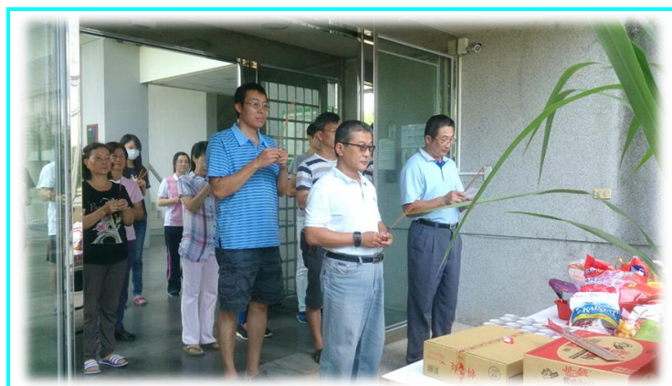
生理組同仁在生理組大門口誠心普渡祭拜 / 105. 8. 19

農曆七月俗稱鬼月，農曆七月十五日為中元節。閩南與臺灣民間風俗，相傳七月一日鬼門開時，陰間的無主孤魂由冥間大神面燃大士普渡真君率領，從陰間到陽間接受供養。因此各地方都紛紛在這1個月舉行『普渡』布施祭祀儀式，今年本組於8月19日舉行普渡拜拜，同時段兔舍也由同仁準備素三牲、水果、餅乾及飲料等祭品，由組長率領全體同仁祈求各項試驗及業務均順利推動、同仁身體健康、生理組六畜興旺。