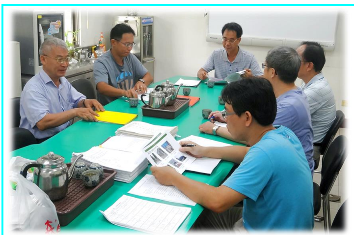
內控稽核小組委員查看稽核文件資料 105. 8. 16