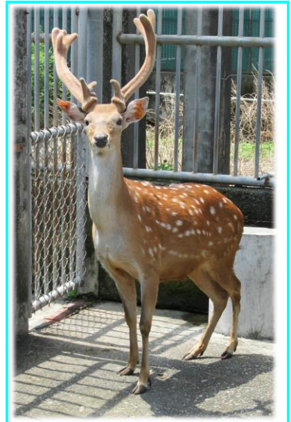
割茸前的公梅花鹿 105.8.4

每年茸角週期重生的時節，也是小梅花鹿主要的出生季節，鹿舍內總能看到充滿活力的小鹿斑比們，靈活跑動或是悠閒躺臥休息的畫面。象徵雄性威武的鹿角重生與稚嫩新生命的躍動相互呼應，吟詠傳唱著大自然生生不息的奧妙。