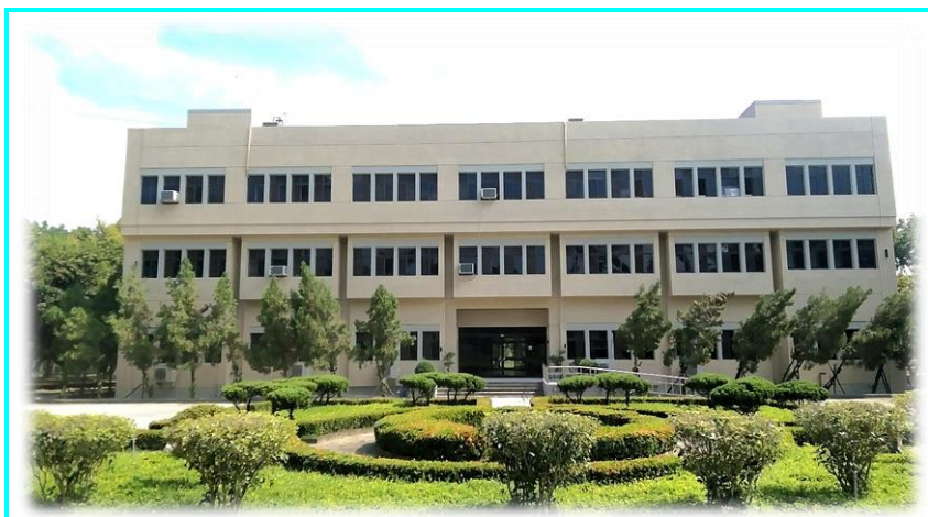
嶄新的經營館 / 105. 8. 5

歷經30年的風雨考驗，大樓屹立不搖，卻也擋不住外牆上歲月的痕跡，再加上高溫炎熱，老舊磁磚經熱脹冷縮，已有許多脫落，因此本組分年度編列經費進行外牆整修工程，相信經過這一次拉皮工程後，又能讓經營館漂漂亮亮的走過下個30年。各位同仁下次經過經營館時，歡迎進來走走，感受一下更新建築的喜悅。