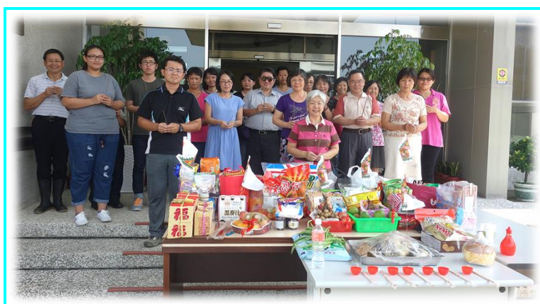
中元普渡拜拜 / 105. 8. 23