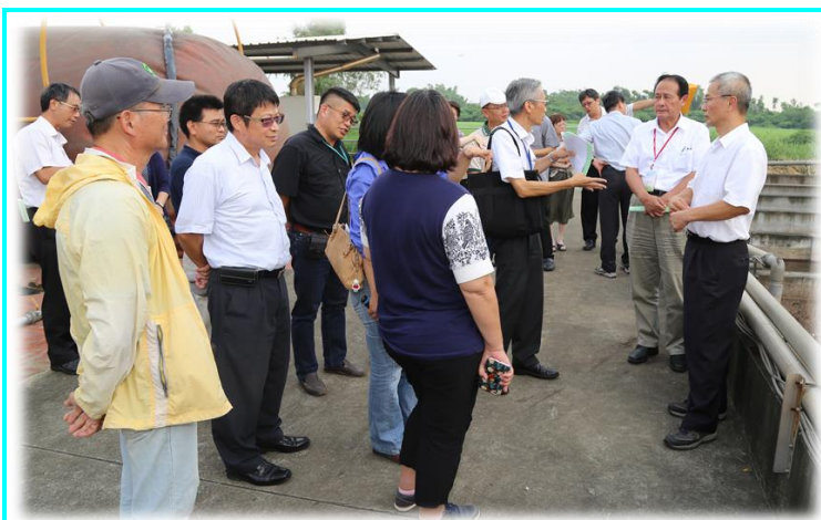
本所鄭裕信所長向曹啟鴻主任委員簡介直立式發酵槽及沼氣發電 / 紀泱竹 提供 105.8.28

行政院農業委員會曹啟鴻主任委員及主委室、科技處、企劃處長官於105年8月28日（星期日）下午視察本所。由於曹主任委員一直以來非常關切綠能養豬、沼氣發電、生物炭及友善環境等議題，本所安排由三長及所內同仁陪同簡介三段式廢水處理場、生物炭產製之熱化學反應器，以及位於畜一股養牛廢水處理場之完全混合直立式厭氣發酵槽、沼氣純化、發電機等設備；並實地進行以曳引機附掛槽車將牛糞尿處理水施灌於牧草地之作業，同時也展示宜蘭大學於本所測試之國產沼液施灌小