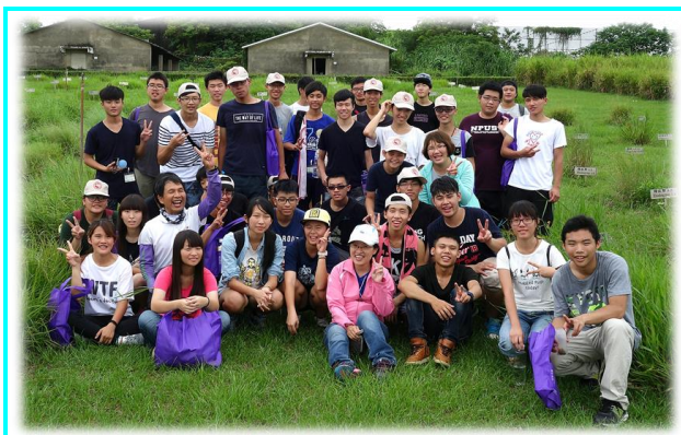
牧草種原鑑別班於種原圃大合照 / 105. 8. 18

此次上課期間恰逢午後雷陣雨期，幸好實習課當日天公作美，讓三天已經上了二天室內課後，終於有機會可以到現場作實際觀察。有室內課程的基礎，再到田間作實地取樣觀察，相信更加深學生對牧草種原的印象，而跑堂測驗結果也顯示同學們獲益良多，因37位同學就有高達19位同學獲得滿分！希望這三天緊湊的課程，能讓參與的學生收穫滿滿，滿載而歸！