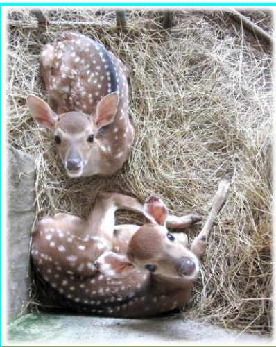
新生好奇的小梅花鹿 105.8.31

每年的7到8月是公梅花鹿的主要採茸時期，雖然臺灣養鹿產業所飼養的梅花鹿頭數遠低於水鹿，但某些特定族群消費者還是偏好梅花鹿鹿茸。收割鹿茸過程中最重要者，為鹿隻之固定，鹿隻固定不當，則可能對工作人員與鹿隻造成傷害。本場梅花鹿鹿茸收割是先以繩索套住鹿腳，再進行人力固定，可說是「很硬」的工作。人力固定鹿隻需有豐富的經驗且「身體強壯」，再加上多名技巧熟練人員的互相配合方可勝任，每次割梅花鹿鹿茸，總是需要3到4名同事大陣仗出動，順便讓體內不常飆高的腎上腺素放縱一下，尤其在高溫的夏日進行此項拼命的作業後，全身像是被大雨淋過後濕透，想想這「打拼作息人」的場景應該很適合拍保力達P的廣告。