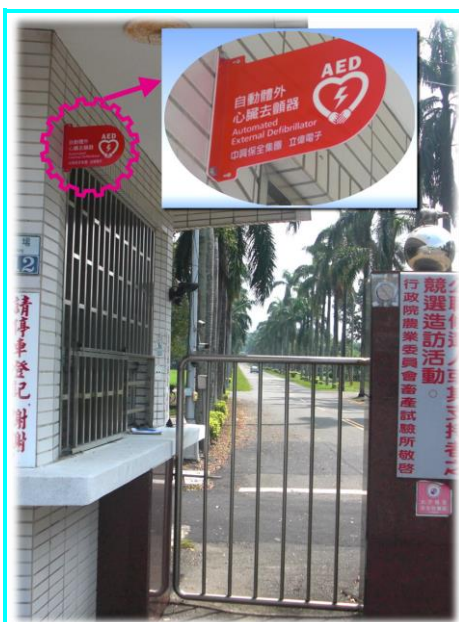
本所大門守衛室設置 AED 設施 / 105. 9. 19

本所自動體外心臟去顫器（AED）設施經秘書室爭取，在有限經費之下，暫以租賃方式於今年5月裝設1台於大門守衛室，明（106）年將以預算編列方式再購置1台，啟動本所建構良善安全環境的第一步。