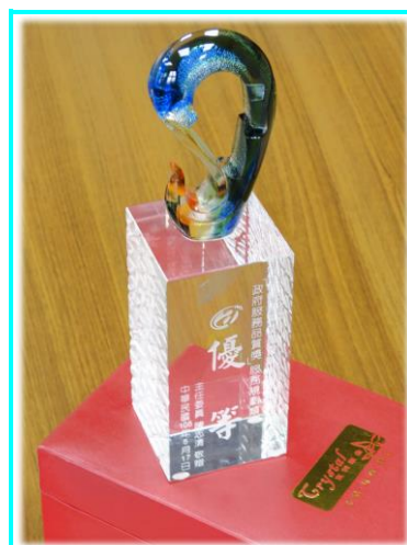
第 8 屆政府服務品質獎 「服務規劃類」優等獎座 / 105. 8. 11