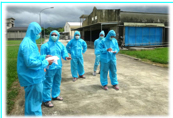
內控稽核小組委員實地稽核禽場設施 / 105. 8. 16