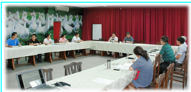
歐潮育主任（中左）廉政宣導

務機密、保管國有公用財產及孳生物應善盡的管理責任，一一詳加說明，並配合違法案例的解說，加深讓全場職員的瞭解。歐主任也告誡所有同仁，這類案件的所得財物或不正當利益雖然微小，但所負的刑責卻是很重，切莫因為一時的貪念因小失大而嚴重影響個人的公務生涯發展。