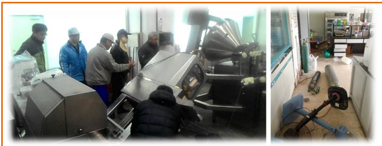
肉品工廠注射機及加工組設備因地震而倒塌或走位 / 105. 2. 6