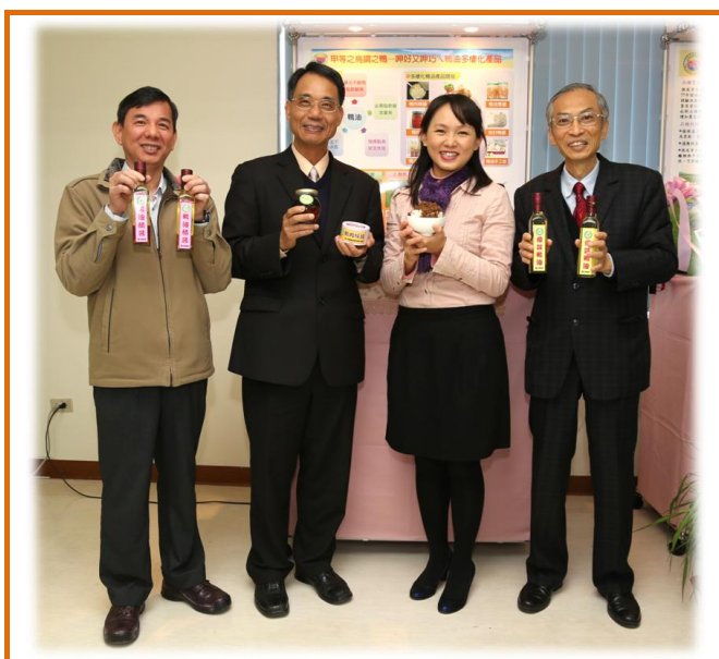
呷好又呷巧ㄟ鴨油多樣化產品展示

本所於1月26日假技術服務組2樓成果展示室召開104年度新化地區年終記者會，藉此向新聞媒體展示本所研究團隊過去一年豐碩的研發成果，記者會展現內容涵蓋五大面向，分別為一、記者會主題，二、新品種（系）育成，三、104年度榮獲獎項事蹟，四、取得智慧財產權之研發成果（發明專利及獲證）及五、科學技術研發成果應用情形。