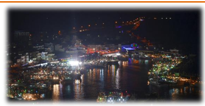
外垵海上燈會 105. 2. 22