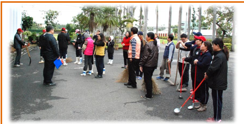
彰化場 2 月 2 日環境教育訓練 / 105. 2. 2