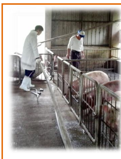
搶修豬隻供水管道 / 105. 2. 6

2月6日凌晨南臺灣發生地震，本組因中央實驗桌移位，桌下水管被扯斷，造成經營館2、3樓走廊淹水；一棟試驗豬舍水塔掉落，影響豬隻供水。時值年假首日，除了已返鄉人員外，全組同仁皆自發性前往系館及豬舍，清除積水、整理掉落物品及接通水管等。在此感謝秘書室即時派員關掉水塔，以及大家全力相挺、負責盡職。有了這次經驗，未來在各項硬體設施維護及物品擺設上，也將會有更完善的規劃。