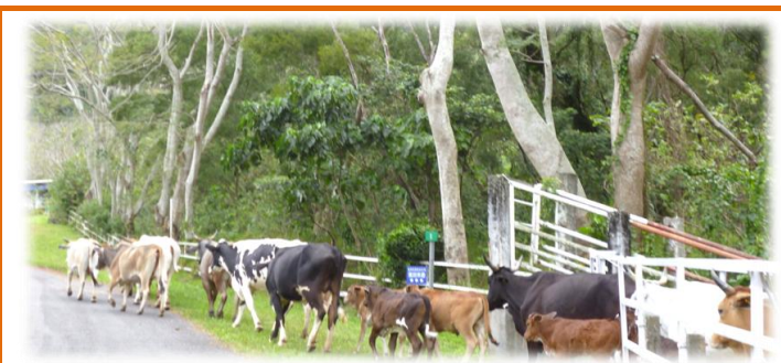
春節過後，換我阿牛們，上山春遊啃青草 105. 2. 24

春節過後，大家立即收心投入工作，2月18日全場羊隻施打口蹄疫不活化疫苗，並聯絡臺東縣動物防疫所，預定3月中旬抽血檢測抗體力價，確保羊隻的健康。牛隻也完成口蹄疫與流行熱疫苗施打、驅蟲及健康檢查後，放山輪牧。豬場更一刻不得閒，因為有許多生醫用小型豬的訂單在年後需要處理。