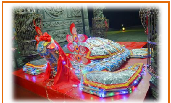
赤崁海菜龜 105. 2. 22

澎湖元宵節與臺灣本島最大的不同點，是沒有燈會或是大型花燈的展覽活動，而是於各廟宇舉辦乞龜祭祀活動，其意義為祈求神明賜龜並保佑來年平安順利之意。筆者從元宵節開始，連續三個晚上參加各地廟宇舉辦之節慶活動，其中最令人驚豔的是西嶼鄉外垵村溫王宮所舉行的海上燈會。當地漁民為了感謝神明庇佑，除了既有的傳統祈福儀式外，於元宵節起連續三日將所有漁船駛進港灣，整齊地停泊於港內，並於晚上七點同時開啟一盞盞2,000 燭光的火繒燈，照亮整個澎湖夜空，同時於各甲頭施放煙火，將港灣點綴得燦爛輝煌，美不勝收。筆者首次在澎湖過元宵，熱鬧氣氛深深烙印在心裏。