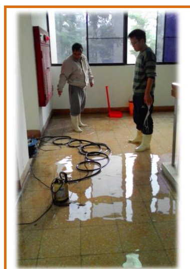
以沉水馬達清除積水 / 105. 2. 6