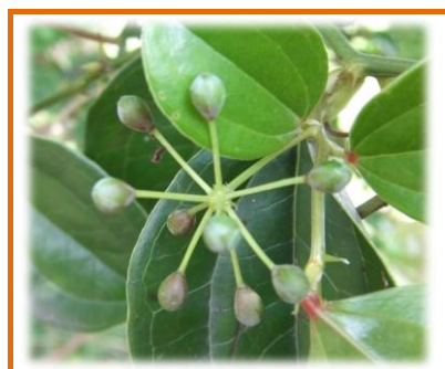
菝葜植株以及未成熟的果實 103. 3. 24

本次要介紹的植物是一菝葜。菝葜為菝葜科菝葜屬的植物，全世界各地都有分布，莖有刺，葉子呈卵圓形並且互生，雌雄異株，會結球形的漿果，漿果成熟為美麗的紅色。菝葜可食，根莖可入藥，日本人有時用菝葜葉取代檳櫟葉包裹在柏餅外面，同時菝葜為琉璃蛺蝶幼蟲的主食之一。除此之外，「沙士」主要調味的原料就是同為菝葜屬的墨西哥菝葜（sarsaparilla）喔！說到墨西哥菝葜，就令我想到藍色小精靈喜愛的食物也是它，不知道大家有沒有跟我一樣的童年回憶？