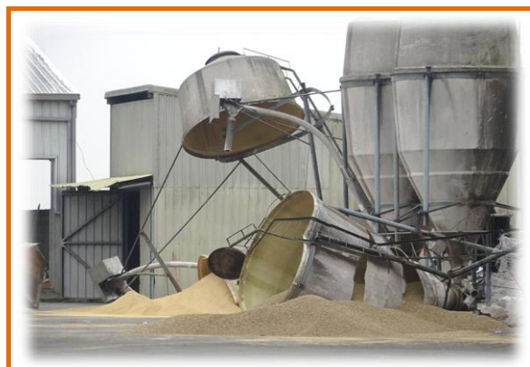
牛舍兩座大型飼料桶損壞倒塌 / 105. 2. 6