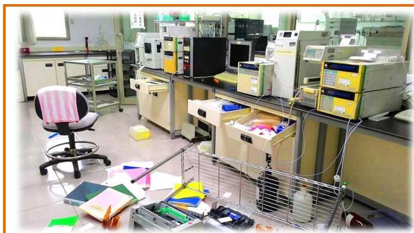
飼料化驗中心實驗室地震後受損情況

今年除夕前的0206大地震，給整個臺南地區造成約2顆原子彈威力的震撼，房屋倒塌、水管破裂，搶救受難的居民成為過年的第一要務。本組營養館大樓剪力牆面出現裂縫、儀器位移、氣體管線鬆脫、抽屜滑開、電腦翻覆，二樓化驗中心水管破裂造成淹水；家禽舍部分