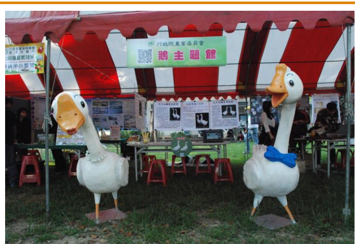
生動活潑的鵝主題館

「鵝主題館」也在溫暖的陽光下展現活潑與生動的一面，帶動民眾與鵝的互動。活動日的前一天，便由同仁先將包括吉祥華鵝、海報、有獎徵答道具及禮物在內的展