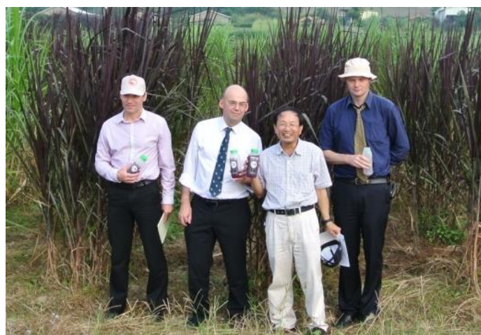
英國學者對花青素飲料讚不絕口

換意見。由於當日天氣炎熱，對於來自英國的團員來說相當不適應，林研究員特別準備花青素飲料招待他們，來賓們對於利用紫色狼尾草製作成的花青素飲料相當好奇，更對好口味相當驚訝！一直詢問何處可購買？對於這次的參訪，英國的學者認為是趟驚奇之旅，也認為我們給了他們一些回國後新的應用點子，更希望以後有合作的空間。