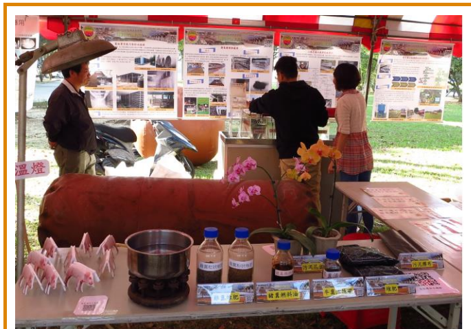
畜牧環保主題館展示攤位

一年一度農畜聯合開放日於 11 月 28 日隆重登場，今年各單位展示內容改以農業主題館方式呈現，經營組以全新之姿—「畜牧環保主題館」為主題，展示歷年來經營組重要的研發成果。為了推陳出新及吸引眾人目光，經大家絞盡腦汁後，決定將儲存沼氣之紅泥膠皮沼氣袋搬至攤位展示，並搭配沼氣加熱爐及保溫燈等設備，以淺顯易懂的實體模型展示方式，讓民眾了解沼氣利用過程；攤位同時展示造粒雞糞堆肥、牛糞活性碳、豬糞燃料油、污泥膠布及污泥花盆等利用禽畜廢棄物資源化之開發產品，藉以引發參觀民眾之興趣。另也鼓勵大家用手機掃描畜牧環保主題館 QR code 登入網頁，就可參加有獎徵答活動，答題正確即贈送自製禽畜糞堆肥一包。果不其然，有獎徵答活動時間還沒開始，已出現排隊等待人潮，待活動一開跑大家爭相答題領獎品，瞬間炒熱攤位現場氣氛，其中不乏有民眾對我們展示的研發產品相當有興趣，也藉此機會彼此間相互交流，達成寓教於樂及知識傳播之目的。