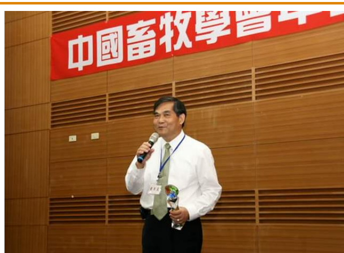
得將人發表感言

28 項優良家畜禽及牧草新品種育成，研發成果取得國內外智慧財產權專利獲證 24 件，推動研發成果技術商品化完成技術移轉授權產業應用 180 件，授權金 32,112 千元，創新育成招商進駐 25 家，輔導畢業 19 家，鼓勵產業投入研發，執行產學合作計畫 59 件，參與農企業合計 44 家，促進投入研發金額計 140,570 千元。