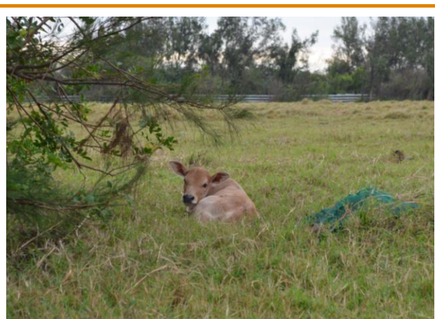
耍自閉的仔牛

目前懷孕黃牛媽媽們已陸續順利分娩，且仔牛出生狀況及適應能力極佳。仔牛在早晨喝完奶後，有的會耍自