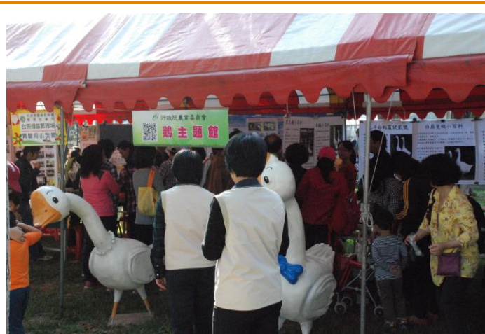
成功吸引民眾的鵝主題館

覽物品載到會場。28日一大早，斯涵、兆弘與長貴叔已將攤位擺設佈置好，林宗毅場長、胡見龍主任也在8點左右到現場關心。沒想到9點才開始的有獎徵答活動，因為人潮洶湧、佳評如潮，準備的禮物在10點多已經全數送完。不過參與民眾並未因為沒有獎品而停止對養鵝主題的答問，倒是讓工作同仁忙到下午4點半活動截止才能夠好好的喘口氣。