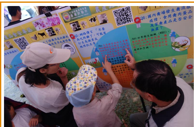
農產品食安專區有獎問答解說

題館的宣導任務。為順利圓滿執行此項任務，本組與加工組全體同仁均十分用心，加上在陳文賢組長與李春芳組長的帶領下，結合兩組同仁的智慧與汗水，共同的目標就是要將本次活動辦的盡善盡美。活動中特別規劃有農產品食安專區有獎徵答與攤位海報展示、PT100 動感氣球創意活動與認識飼料原料等活動，攤位每位輪值的負責同仁，無不秉持專業、熱情與活力的精神，服務每位蒞臨本攤位的來賓，讓大家都能有賓至如歸的感覺，同時也讓大家能夠了解政府對國內食安問題的重視，更重要是要團結大家的力量，一起來維護國內的食品安全。