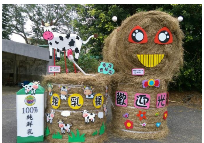
遺傳育種組作品「乳牛生產力 4.0」

感謝布置團隊在有限經費下，耗盡腦力手工製作出精美的布置道具，完美體現了智慧機器人全天候自動擠乳所達到省時、省工、高效率的核心概念，更有幸讓農委會陳文德副主任委員、臺南改良場王仕賢場長、本所黃英豪所長及主計室吳錦禎主任駐足拍照留念，成功讓人留下深刻的印象。