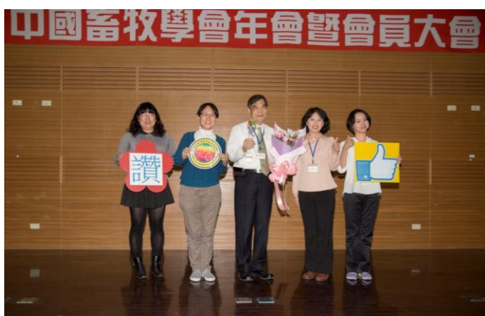
同仁上台為所長得獎按讚

立雙方研究發展的合作關係並促進臺灣畜牧產業之國際能見度。此外輔導畜牧產業農民精進生產效率，辦理「高產茸鹿評選頒獎會」，「優質牛暨天噸牛頒獎會」，「種畜禽個別性能檢定之精力獎種土雞、精力獎種公豬、高繁殖種公羊獎、高體重仔羊獎」等評選工作，促使種畜禽優質化。協助產業進行種畜禽基因檢測，輔導 133 家畜牧場進行種畜禽供應體系及其生物安全防護網建置，產業輔導實績成果豐碩。