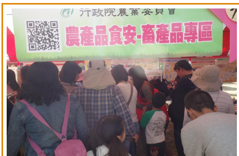
農產品食安專區攤位人山人海 / 洪靖崎 攝影

11月28日(星期六)是畜產試驗所與臺南區農業改良場聯合舉辦「農畜聯合開放日暨第19屆種苗節活動」的日子，今年活動與往年不同的地方，就是不再以各業務單位為展覽攤位的主軸，改以豬、雞、鵝、鴨、牛、羊、牧草、畜產加工與農產品食安專區等主題為活動宣導的核心項目。今年很高興營養組可以與加工組一起負責「農產品食安專區」主