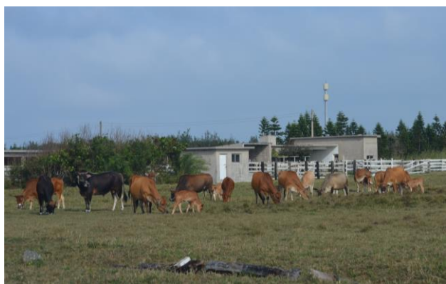
牛群彼此間和平相處，為本站更添氣象

閉自己躲在樹叢內放空；有的會當跟屁蟲跟著媽媽到處閒晃；有的會三兩隻聚在一起，互相玩耍打鬧還不時發出可愛的小牛叫聲，各式各樣的小牛行為都吸引筆者的目光，並駐足觀看。