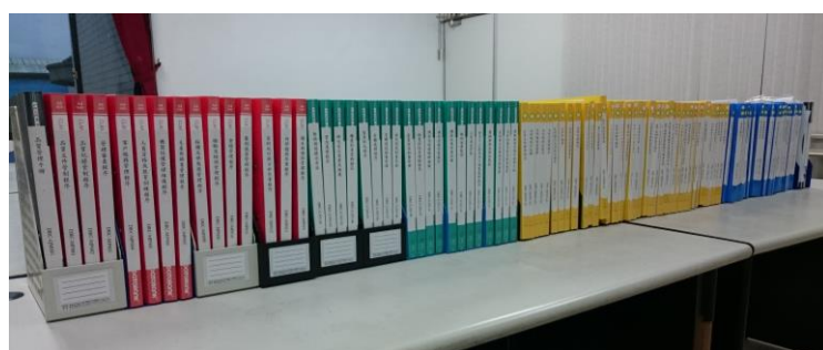
桌上滿滿的檔案都是最少疾病番鴨族群的 ISO 管理文件，管理起來一點也都不輕鬆。

自從去年底由魏良原副研究員一番用心準備，使宜蘭分所的最少疾病番鴨族群成功通過 SGS ISO 9001:2008 品質管理系統驗證，確保最少疾病的番鴨有嚴謹的 SOP 管理流程，並能維持高品質的胚蛋與雛鴨供應。而今年是宜蘭分所正式執行 ISO 系統的頭一個年份，