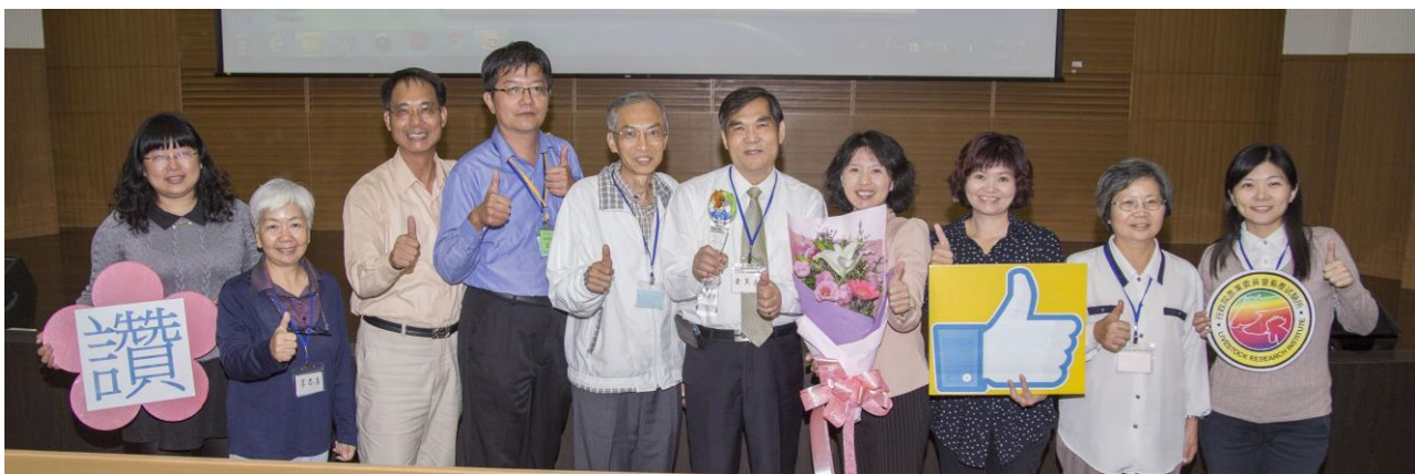
同仁們上台獻花並為所長得獎按讚歡呼

行政院農業委員會畜產試驗所 Facebook https://www.facebook.com/TLRI1940/?fref=ts