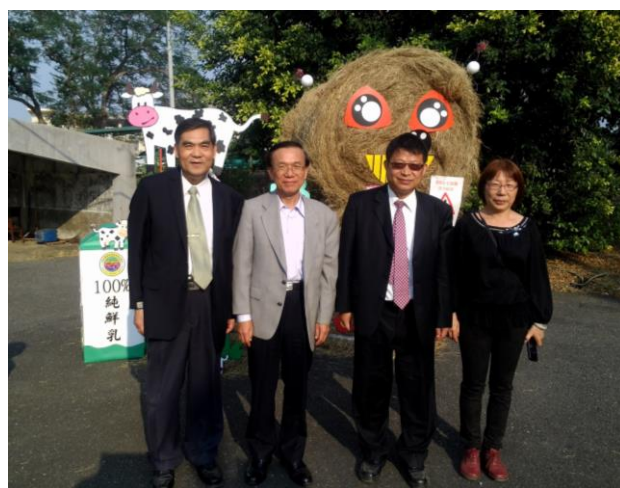
貴賓於本組作品前駐足拍照，農委會陳文德副主任委員（左 2）及臺南改良場王仕賢場長（左 3）/ 陳翠妙 攝影

今年由於遺傳育種組配合行政院生產力 4.0 方案，規劃推動乳牛產業生產力 4.0，期望透過智慧型機器人提升臺灣乳牛產業並轉換為智慧型的產業，因此特將牧草布置主題定為「乳牛生產力 4.0」。