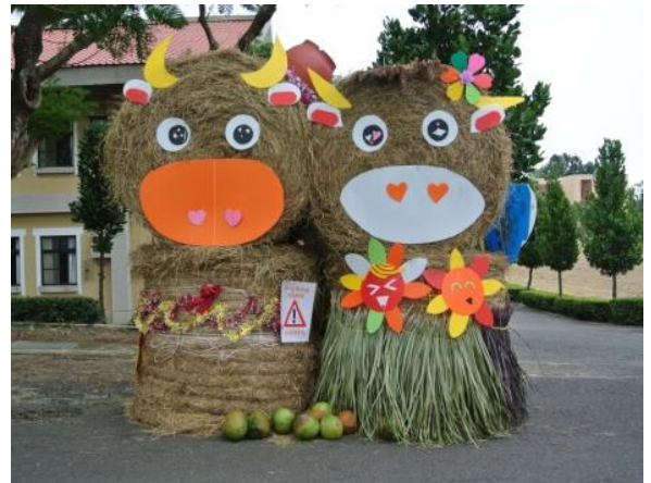
飼作組以夏威夷風格裝飾牧草捆包

另外配合人事室辦理的牧草裝置藝術比賽，本組以夏威夷風格的牛哥牛妹作品榮獲第四名，以乾燥的狼尾草葉片編織成草裙和尾巴，甜高粱穗軸作為瀏海，搭配閃亮的眼神拼貼，乾草捆包化身成可愛的牛哥牛妹，迎接前來農畜聯合開放日活動的民眾。