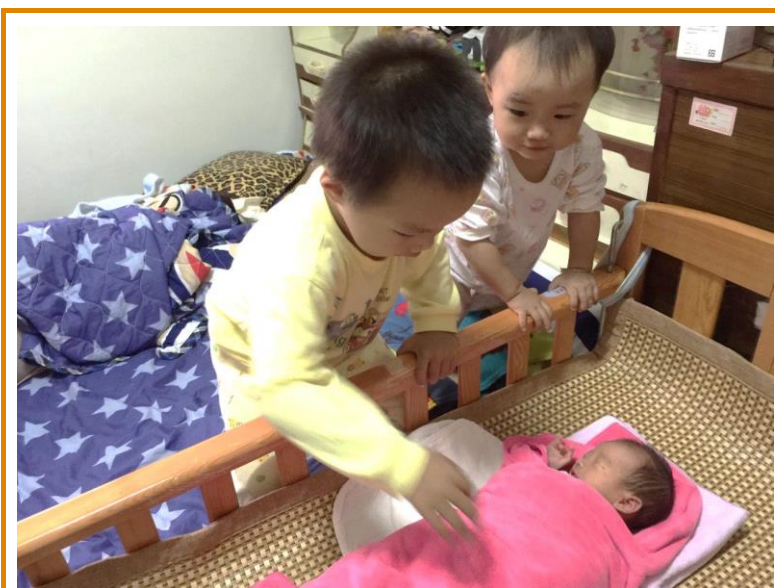
阿展展哥哥與小蒟蒻姊姊一起照顧小冬冬

其實接到雅醇生寶寶的電話，全組無不驚呼：「怎麼比預產期早了快一個月？」自從今年雅醇懷孕後，雖然肚子一天天