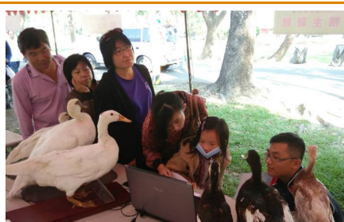
分所同仁正熱心的指引小朋友上網尋找有獎徵答的解答

今年度的農畜聯合開放日於 11 月 28 日在總所盛大展開，農畜開放日是由總所與臺南區農業改良場共同舉辦的年度盛會，本活動行之有年，可說是兩單位的共同傳統。如此重要的盛會，宜蘭分所當然不會缺席，本分所不但提供鴨隻標本吸引遊客目光外，還別出心裁設計好幾道有關鴨隻的題目，與遊客進行有獎徵答互動，任何答對者都可以免費獲得由本分所提供的