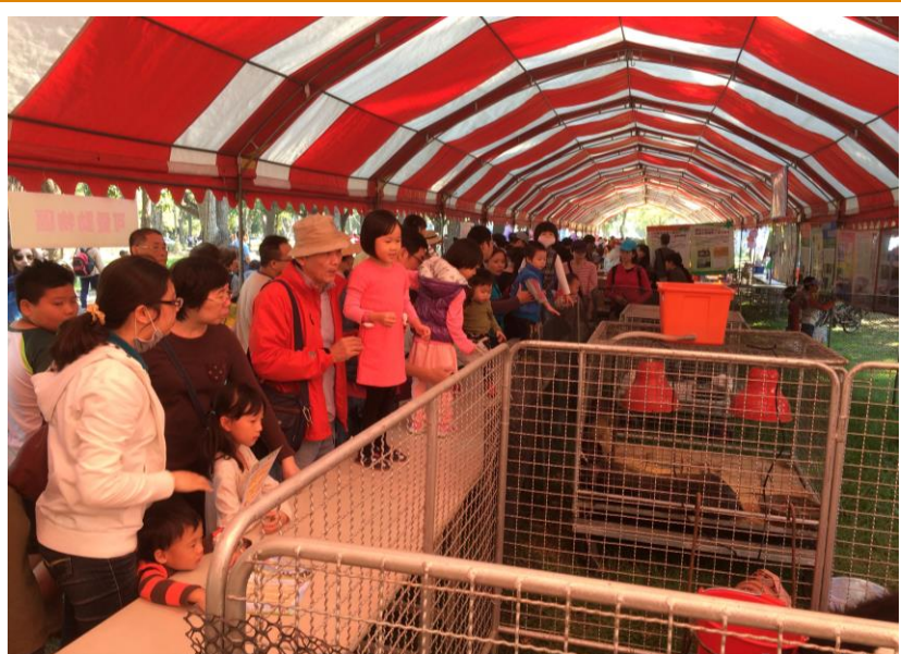
民眾參觀可愛動物區之情形

試白絲羽烏骨雞」與「桂丁雞」特性等。有別以往，這次農畜聯合開放日，產業組首次提供有獎徵答活動，也提供民眾有關雞的基本常識，包括市售的雞蛋會不會孵出小雞及公雞、母雞哪一種的顏色會較為鮮豔等，讓民眾了解其原因或理由，使民眾有更深刻的印象。