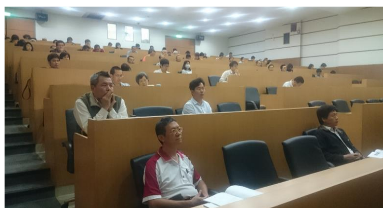
座談會與會人士專注聆聽台上的報告

為配合「2015 農畜聯合開放日暨第 19 屆種苗節活動」舉辦一系列活動，本所產業組於 11 月 26 日舉辦一年一度草食動物產學技術交流座談會。座談會於本所技術服務組二樓國際會議廳舉行，當日產、官、學界與會人士約 130 人。本次座談會，因所長另有要公，不克出席，由鄭裕信副所長代理主持。在簡單隆重的開幕式之後，進行「狼尾草台畜五號之