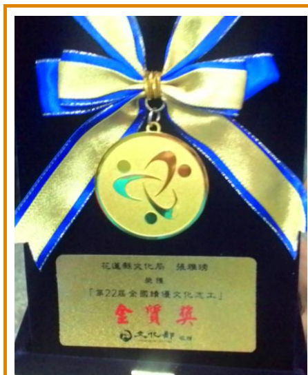
「全國績優文化志工」金質獎

雅琇姐表示，志工工作要能做得盡善盡美，全仰賴志工夥伴的相互配合，還有她的兒女對於她投入志工活動相當支持，她才能無後顧之憂地在文化局擔任志工，於此，她十分感謝。