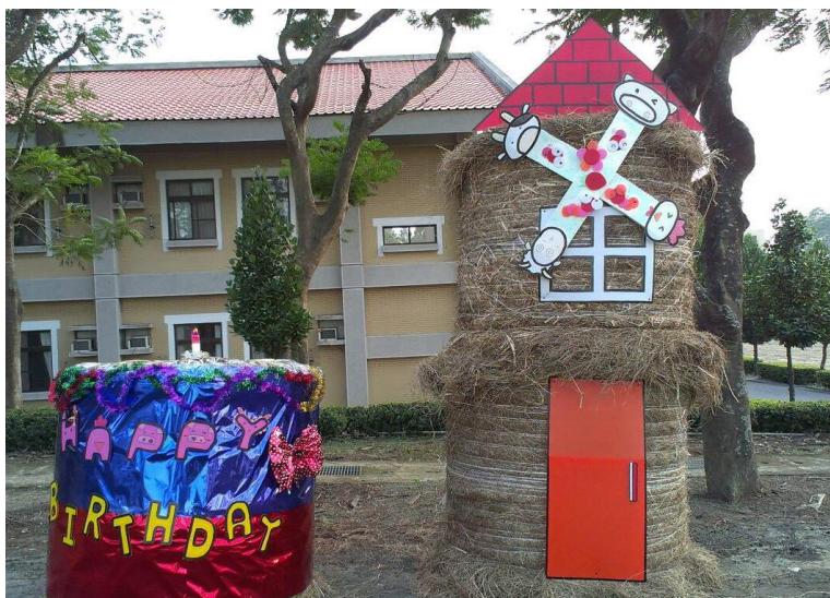
「風車、牧草與蛋糕」牧草包裝置藝術

牧草，也能呈現出如風車與蛋糕般的和諧關係與高雅溫馨的感覺。雖然牧草對大部分的人而言，只不過是一種用來餵飼動物的草料，但是當大家有機會再次看到風車造型或享用蛋糕的同時，是不是會讓您想起，曾經在畜產試驗所與牧草度過的那段歡樂時光，同時別忘了「風車、牧草與蛋糕」這三種平凡的事物就在大家的身邊。