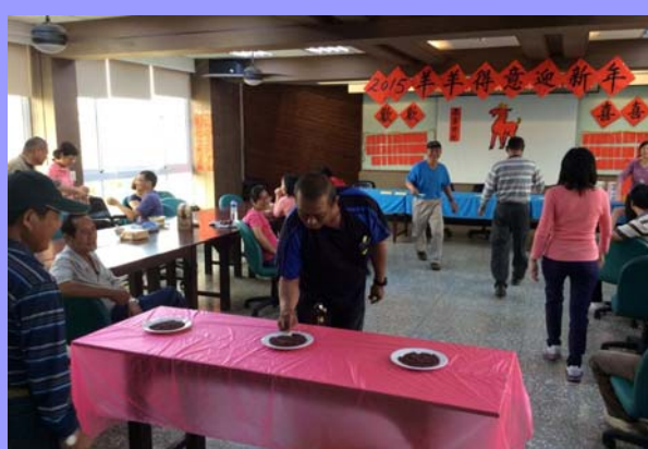
新春康樂活動—夾紅豆 / 葉瑞涵 攝影

恆春分所新春活動節目豐富，除了戶外活動之外，還邀請墾丁國小十鼓隊進行才藝表演。這些年輕有朝氣的可愛小朋友們，打起鼓來不但力道足，還整齊劃一、充滿自信。在指揮的指示下，俐落地更換曲目。活潑的肢體動作配合