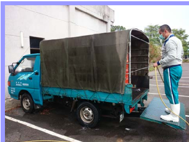
運禽車清洗消毒之情形

臺灣此次疫情，自 104 年 1 月 9 日發現首宗確診案例起，截至 2 月 28 日止，計送檢 879 場，確診 855 場，完成撲殺 850 場，計有 H5N8、H5N3、新型 H5N2 及 H5 亞型等病毒株，除感染雞隻外，也感染鴨、鵝，並造成鵝隻大量死亡。由於畜產試驗所為國家雞隻重要種原保存及研究機關，故立即提高養禽場生物安全層級，每天由產業組謝昭賢組長及產業組三股職員，以視訊會議方式輪流參加由農委會王政騰副主任委員擔任指揮官主持之「行政院農業委員會動物疫災災害緊急應變小組」會議，隨時掌握禽流感疫情發生情況及重要防疫作為；另產業組每週召開強化防疫會議，會中除報告動物疫災災害緊急應變小組會議重要政策外，並加強同仁生物安全教育訓練，持續加強場區生物安全措施，也同時進行種蛋的異地保種，以避免種原因為感染禽流感而滅絕。此外，產業組雞隻將做為哨兵家禽來源之一，以供復養場監測禽流感病毒使用。隨著季節更替，天氣逐漸炎熱，雖然禽流感疫情通報案例減少，似有減緩趨勢，但仍不能掉以輕心。未來，家禽業者復養，將著重於設計高生物安全設施之禽舍，以杜絕攜帶病原之候鳥入侵。最後，希望國內的家禽業者能順利渡過此波禽流感疫情，家禽復養及重建工作順利進行，再現昔日榮景。