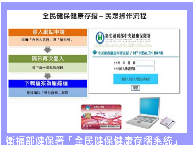
衛福部健保署「全民健保健康存摺系統」

健保署於去年 9 月起，於全球資訊網建置「全民健保健康存摺」系統，提供被保險人申請最近一年就醫資訊，包括：門診或住院醫院所名稱、就醫日期或住院日期、交付調劑、檢查或復健治療日期、疾病名稱（並非診斷）、醫療處