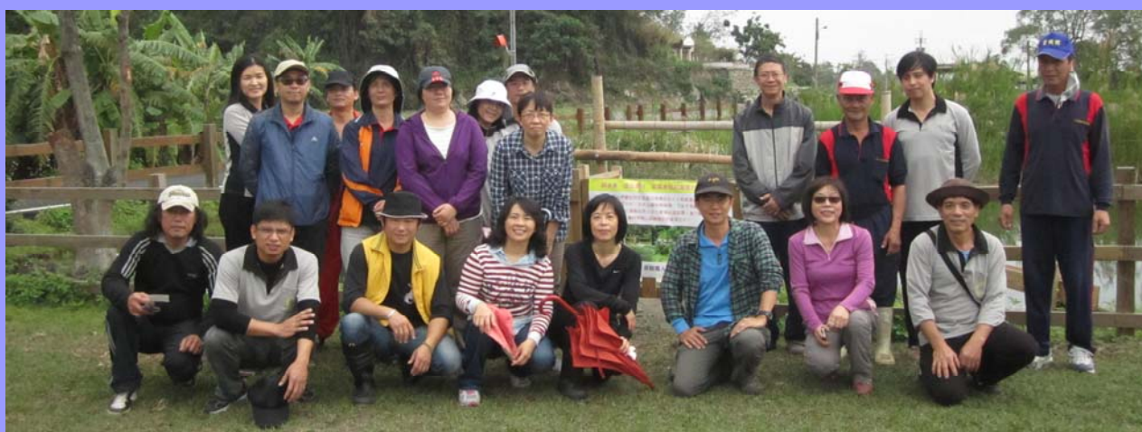
水車模組前合影留念

過完春節連假，大地春回，驕陽當空，氣溫暖得讓人穿不住長袖。本場蘇安國場長率領諸位同仁進行新春團拜互道恭喜，一番提醒勉勵之後，緊接著便是富有環境教育意義的健行活動。花蓮山碧水綠，景色宜人，花蓮場四周有諸多風景名勝，就算不提風景名勝，單是一個簡單的步道也別有一番動人之處。當日沿著花蓮場周邊健行，沿途瞧見了許多盛開的花，像金銀花、櫻花，還有很多我叫不出名字的花，只餘枝桠的落羽松林更有一種淒涼的美感。在生態水利步道旁架著一個水車模組，介紹往昔農村時期人們如何克服水低田高、不利灌溉的窘境。途中經過蝴蝶生態園區，是個開放自由參觀的小公園，栽植一些蝴蝶的食草植物，唯一遺憾的是這個時節蝴蝶不多，未能看到群蝶飛舞。一趟健行下來，不僅豐富知識，也順便舒展一下過年期間都未活動的筋骨，以愉快的心迎接嶄新的一年！