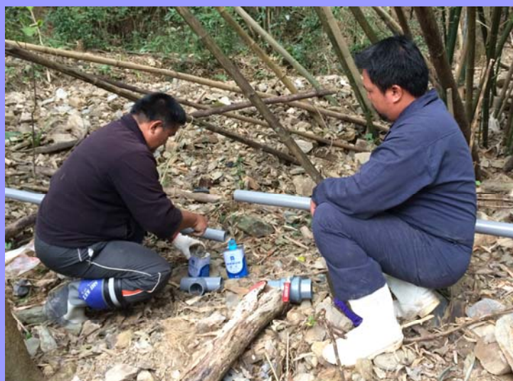
畜舍水源供應管路重新接合配置

臺東場畜舍水源供應主要來自於山區水路管線（另有備源之地下水與自來水），1月21日畜舍同仁發現水量嚴重不足，為避免影響動物飲水及畜舍清洗作業，本場同仁動員沿線巡視水源管線，該處水源是位於場區南側山腳處的小山澗，是本場歷史悠久的主要水脈之一，相傳清朝年間時任臺東直隸州州官胡鐵花（國學大師胡適之父）軍營之用水來源，故名“營斗”，數十年來源源不絕地供應本場畜舍與辦公廳室之用水。但近年來氣候變遷劇烈，豪大雨與地震均較往昔頻繁，平日稍有雨量累積，往往就引發間歇性的土石崩落，造成供水管線損壞及阻塞。