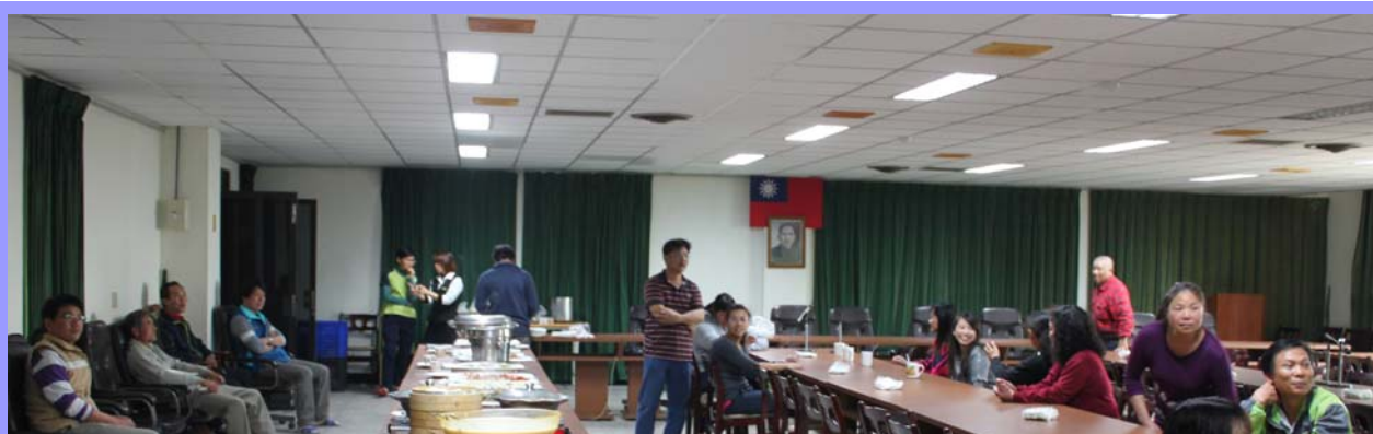
員工慶生會情景

本場為促進同仁間情感交流與互動，凝聚團隊向心力，以及鼓勵同仁參與正當文康活動，紓緩工作壓力，提高工作效率，2月13日中午於本場2樓會議室舉辦慶生會，邀請場內所有員工參加並與壽星共同分享這個大家庭帶來的溫暖與快樂。