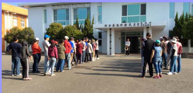
分所長以 " 莫忘初衷，發掘自身價值 " 與大家共勉