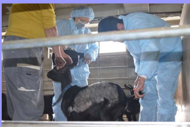
注射疫苗完的羊隻給予標示