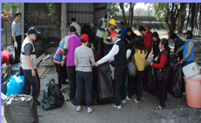
資源回收實地操作情況

理週邊的環境，舉凡桌面、地板、門窗與陳年雜物等辦公室環境以及現場管理室、更衣室、守衛室與廁所等現場環境，都打掃得乾乾淨淨。得到第 1 名的總務室同仁，連窗戶都拆下來洗了，任何一個小角落都不放過，經過大掃除之後，整個工作環境變得乾淨整齊，相信在未来新的一年同仁們工作起來會覺得更加舒適與順心。