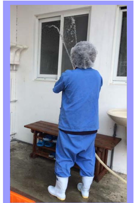
畜舍周邊環境清潔

辦公室及畜舍平時就得定期清掃，維持程度上的清潔，每年過年前臺東場都會安排全體員工進行場區大掃除，在撣拂塵垢蛛網，疏浚明渠暗溝之後，迎接全新的一年。