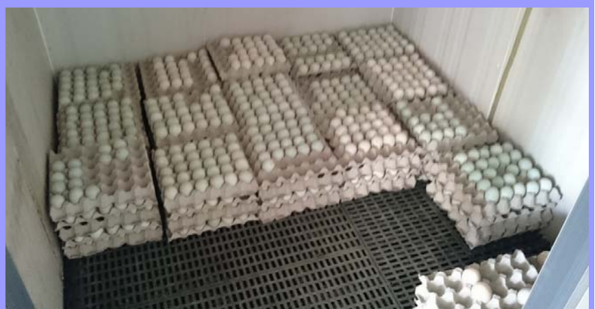
種蛋在花蓮區農業改良場蘭陽分場保存情形

禽流感威脅尚未解除，本分所為了做好長期抗戰準備，保護珍貴的鴨隻種原，每週收集種蛋並定期送到花蓮區農業改良場蘭陽分場保存。這些種蛋存放在 17℃ 的冷藏櫃中，在此低溫下，種蛋可以保存約 2 星期而不影響日後的孵化率，但 2 週的保存期限其實並不長，所以為了一直維持良