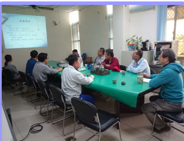
禽流感強化防疫會議

禽流感，顧名思義就是發生於禽類身上的流行性感冒。禽流感則依據其表面蛋白，分為 16 種 H 亞型與 9 種 N 亞型；病毒又可依據其 HA 蛋白切割位之鹼性胺基酸數目，分為強毒株與弱毒株，一般而言，鹼性胺基酸數目愈多者，病毒之毒力也愈強。此外，禽流感病毒也依其地域分布，分為歐亞型與美洲型兩種型別。臺灣原有之 H5N2 亞型病毒，其 HA 與 NA 基因之來源是美洲型病毒，而其 HA 切割位鹼性胺基酸數