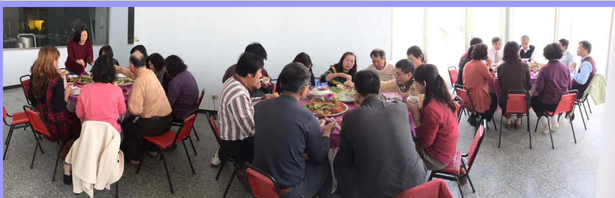
席開三桌吃尾牙

時間飛逝，轉眼間一年又將結束了，為了感謝同仁一整年的辛勞，席開三桌，讓大夥兒可以聚首聊八卦。今年尾牙的菜色，低油低鹹，還有清淡的海鮮火鍋，看到大家這麼拼命在“掃桌”，想必菜色應該是很美味吧！剛好又可以藉由這一餐讓大家的胃先暖開機一下，畢竟尾牙結束，緊接而來的就是過年的“澎派”美食，如果一年結束腰圍就多一圈負擔，不知道新的一年大家的負擔會不會亦呈倍數成長？不過，最重要的是感謝大家整年的辛苦工作，希望藉由“吃”，讓大家把過程中遇到的辛苦拋諸腦後，用吃飽滿足的喜樂來迎接新的開始～