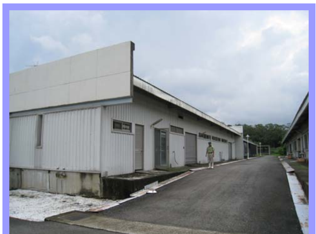
同仁恭賀大家羊年得意豬(諸)事大吉

二月份欣逢國人一年之中最重視的節慶“春節”，也就是農曆的新年。農曆正月初一到初五是『新春』或『新正』，而每一年開始第一天的早晨，即是俗稱的「元旦」，正是國人最重要的節慶之一，現在稱為『春節』。在國人傳統觀念中春節就是與親人團聚的好日子，讓大家在辛勤努力工作一年之後，能夠有一段休息的時間，一起回到最溫暖的家與至親好友們團聚與享受天倫之樂，分享大家在過去的一年裡付出的辛勞與收穫。但是在新春假期間有一部分的人，