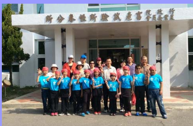
同仁與墾丁國小十鼓隊合照