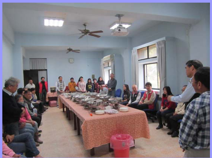
年終聚餐盛況

藝系，第一份工作就到太麻里鄉公所服務，從基層開始了解臺灣農業。而旅行是他的興趣，古人說：「讀萬卷書不如行萬里路」，所以當兵時選擇參加尼加拉瓜農業技術團，親身體驗世界有多大，並且每次出國旅行時，也會東問西問當地農業趣聞，以增廣見識。好奇與創意是育種家特質，希望未來能以天馬行空的思考方式，打造一個更有特色的臺灣農業。