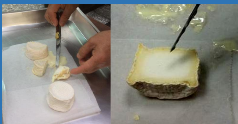
左圖：法式白黴羊乳乾酪。右圖：法式白黴羊乳乾酪剖面圖。刀子所指顏色較深、厚度約 0.5 公分之部分即為奶油層

恆春分所近年來致力於開發羊乳加工產品，其中法式白黴羊乳乾酪絕對是其中技術層面最複雜、最需用心製作的試驗產品。香濃的羊乳中添加乾酪專用菌種以建立基礎風味，而後再以凝乳技術使口感細膩，最後再以白黴熟成技術進一步豐富乾酪之風味及口感。如此繁複工藝之羊乳乾酪，其外表佈滿均勻白色皺摺，切開後由外而內分別為白黴層、奶油層及乾酪層。白黴層散發黴菌特殊香氣、奶油層口味濃郁、乾酪層則維持綿密口感。奶油層是白黴分解羊乳乾酪所形成之天然產物，為黴菌熟成乾酪之特色，由於其組成分受到黴菌菌種、熟成程度及羊乳成分之影響，造就法式白黴羊乳乾酪獨一無二、難以仿冒之價值。此外，為了調和羊乳的膾味、迎合國內消費者的口味，部分產品在加工過程中特別