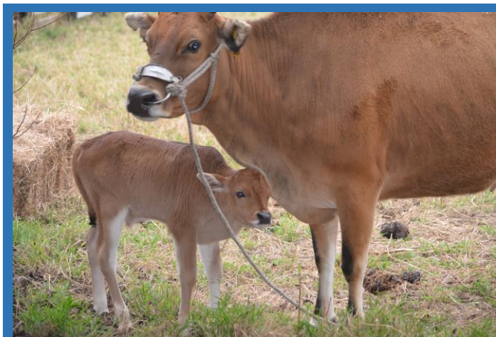
依偎在母牛身旁的小牛

工作站於 103 年底由恆春分所引入的臺灣黃牛(1 公 4 母)，已有一母牛於近期產下一頭健康的小牛。母牛因剛生產及未熟悉現場執行餵飼和照顧牛隻工作的叔叔阿姨們，只要稍微靠近，母牛就會做出恫嚇外來威脅者的動作，可看出母牛保護小牛的自然母性流露，讓看到此幕的現場餵飼及照顧牛隻的阿姨叔叔笑呵呵。