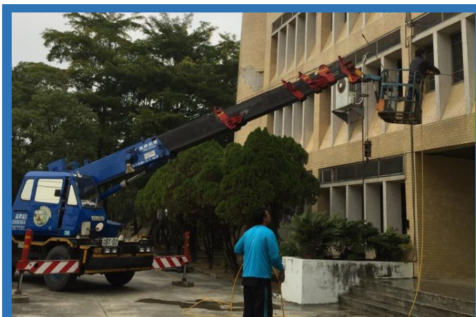
加工組外牆、玻璃清洗

加工組除了例行的打掃外，礙於沒有陽台，想要清洗二樓以上的外牆及玻璃著實困難，因此1月26日請清潔公司幫忙清洗外牆及玻璃窗，同時全組同仁則從內刷洗全館玻璃，內外夾攻清除髒污，不過畢竟是有歷史的建築物，不仔細看還真看不出來是有清洗過的，但從辦公室往外看，還是有種煥然一新的感覺（陽光透進來終於有刺眼的感覺了～）。在此，要感謝各位同仁放下手邊工作一起打掃，希望大家的心情亦能“除舊佈新”。