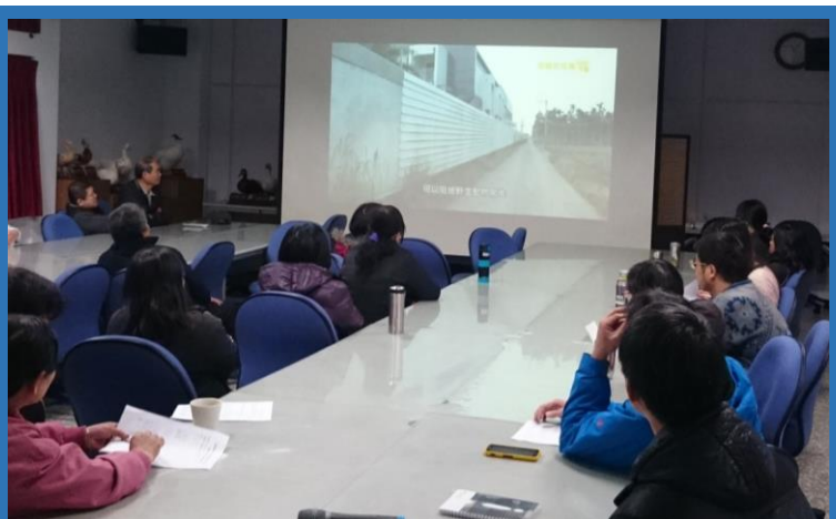
宜蘭分所所有員工在農訓中心觀看 防疫宣導影片

禽流感是威脅世界各國家禽產業的重要疾病，其病原會隨著候鳥的遷徙在全球間相繼傳染，往往造成大爆發，致數以千萬的家禽死亡，嚴重衝擊家禽產業。臺灣位於候鳥遷徙路線的中繼站，因此，候鳥遷徙季節偶有零星的禽流感疫情傳出。這次臺灣在1月份爆發的禽流感，其病毒株共有 H5N2、H5N3 和 H5N8 等3型，皆屬高病原性，對家禽