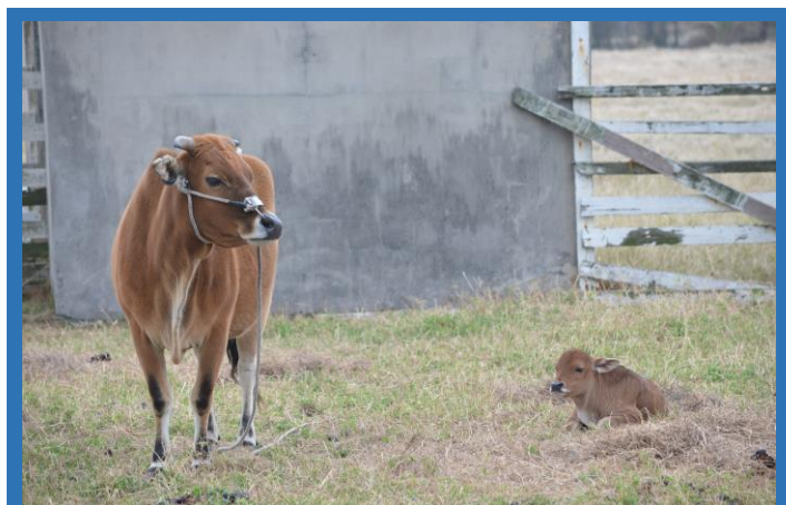
小牛休息時，母牛仍處於警戒狀態

黃牛被毛毛色有黃色、黑色、褐色、赤色、白色等不同混合色，不全靠顏色判斷，臺灣黃牛相較雜種肉牛，耳朵較小、牛背有突起肩峰、骨骼纖細、鼻鏡呈黑色。且性情溫馴，耐粗旱，抗病能力佳的優點。在臺灣早期農業社會文化中，有其不可抹滅之影響力，至今仍可在早期農業社會的各種創作中如歌曲、故事、戲劇、繪畫等看見黃牛的身影，也有很多方言和俚語，都是以黃牛的意象來形容人的行為。