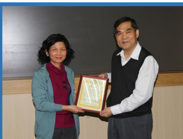
秘書室（事務）榮獲室內 A 組第二名

為建立健康、清潔、衛生、舒適之工作環境，並增進團隊精神，提高工作效率，本所 103 年下半年整潔比賽檢查已於 1 月 8 日辦理完竣，競賽成績除併上半年成績統計公布外，參加清掃學習的同仁亦可獲登錄環境教育學習時數 2 小時。