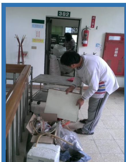
大掃除實況

時值歲末年終之際，每年除舊佈新大掃除除了環境整潔美觀外，亦具有迎接嶄新的一年之意涵。此次恰好適逢秘書室舉辦 103 年度環境整潔比賽，本組在上(102)年度榮獲室內 B 組第二名的佳績，可說是得來不易，因此，倍具信心能於今年度再度爭取佳績。緊接著，全組同仁共同規劃、參與此次整潔比賽之打掃活動，且此次打掃之重點特別針對本組二、三樓各實驗室，舉凡門窗、實驗桌面、儀器物品及地板，皆力求整齊與乾淨，希冀提升工作環境並獲得佳績。