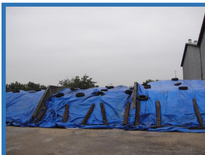
玉米青貯製作完工照

製作玉米青貯順序如下所述：在田裡，黃熟之玉米株利用機械採收，經細切後，便成了青割玉米，由大卡車運到目的地之青貯槽卸下後，再以挖土機將其集中、堆置及壓實。再放置經太陽曝曬 1-2 天後，除可降低青割玉米含水率，並使其堆置更緊實。最後，先覆蓋上一層透明塑膠膜，再蓋上帆布，由照片可看到產業組一股同仁賣力為青割玉米「穿新衣」，再以輪胎及枕木壓實，玉米青貯之製作便大功告成了。