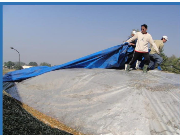
產業組一股同仁賣力為玉米青貯「穿新衣」

又到製作玉米青貯的時間了，由於本所產業組之牛隻大多以自製之玉米青貯為主要芻料來源，每月玉米青貯的使用量約 100 公噸左右，一年約需 1,200 公噸。為獲得長期且穩定的芻料供應，每隔一段時間，產業組便會製作大量玉米青貯；玉米青貯製作完成後，約須放置 1 個月的時間，待微生物與青割玉米發酵作用完成，品質穩定後，才可開封使用。