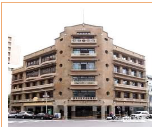
臺灣第二座百貨公司「林百貨」

臺南府城是臺灣文化最悠久的起源地，街頭巷尾流傳的「一府、二鹿、三艋舺」即反映臺灣繁華歷史由南往北發展的軌跡，也因此造就文化古都的地位。唯有漫步於街道巷弄間才能感受到文化古都特有的城市氛圍和樂活生活型態。不同於北部的緊湊腳步，在臺南府城，適合慢活的生活步調，卸下緊張、放下繁忙，帶著輕鬆愉快的心情舒緩漫遊，一定可以讓你感受到精神和