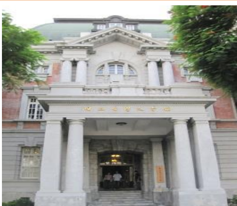
舊市政府辦公廳今為臺灣文學館

心靈被耙梳過的暢快感覺，再次發現古都的另一種風情。而漫漫暑假即將接近尾聲，如不想從事戶外活動曝曬於烈日高溫下，不妨來趟藝文之旅、知性之行，當個文青，感受著濃濃文學氣息的薰陶，讓身、心、靈三方面都獲得滿滿的滋潤和啓迪。