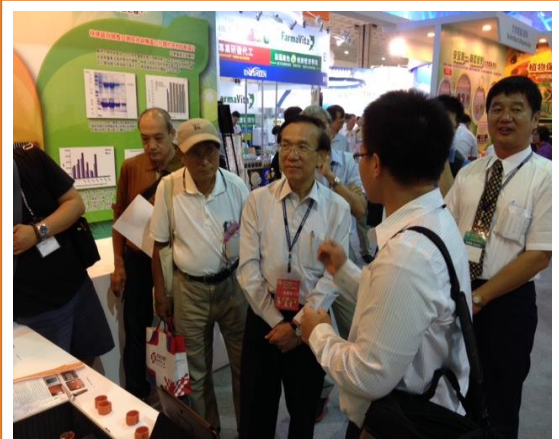
農委會陳文德副主委(中)聆聽彰化場人員解說展示設備內容

本年度生技展在 7 月底圓滿落幕，彰化場於農業科技館展出智慧型水禽產蛋辨識監控系統的軟硬體設備，在 4 天的展出期間，吸引許多好奇廠商與民眾詢問，各級長官來攤位巡視時也都不禁停下腳步仔細研究系統設備與聆聽解說，對於成果也相當滿意並表嘉許。智慧型水禽產蛋辨識監控系統是彰化場以最新的 RFID 無線射頻辨識結合 ICT 資通訊技術的重大發明，目的在於能精準量化商業環控種鵝舍的個別鵝隻產能資料，同時能以資料庫分析並篩選出寡產鵝，替業者挑出真正會生蛋的種鵝以增加效能收益，對養鵝產業將是一項劃時代的發明。