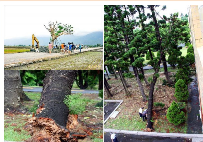
遭麥德姆颱風連根拔起的「金城武樹」(左上)與本所受白蟻啃蝕的肯氏南洋杉

一棵樹就是一個生命，代表著自然界植物生態體系的存在，樹經由光合作用能製造新鮮空氣供萬物生存用，另外也有涵養水源、護持土壤、散熱乘涼等功能。每株樹上面都有著依附它為生的昆蟲、鳥類及動物。而田邊的樹（如金城武樹）則是給老農和老牛工作累了可以休息喝個水，遮陰納涼的地方。而農田旁邊一般不會種太多樹，因為農作物會因樹蔭遮住，沒有充足陽光照射和露水滋潤會影響生長和收成。