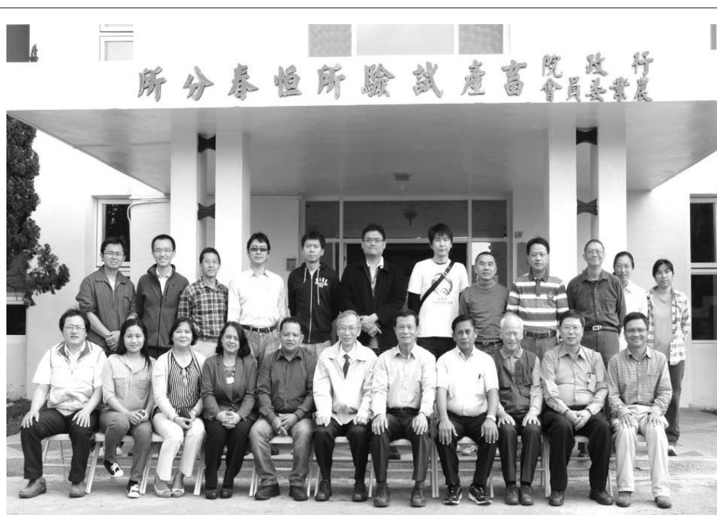
台灣與菲律賓養羊科技研討會與會成員合照

本次 3 月 4 日臺灣與菲律賓雙邊研討會由恒春分所主辦，菲方關注的議題包含提昇山羊品質，降低生產成本；恒春分所主要議題則為臺灣山羊產業介紹、畜牧生產本土化及環保、生態保育，雙方進行廣泛的資訊分享與經驗交流。