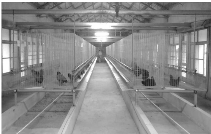
配有自動刮糞設備的種雞舍

員均可舒適的生活與工作。看著剛搬進新雞籠的雞隻，從一開始蹲在原地不動，到後來紛紛站起來展翅運動、翻身整羽，想必他們的心情也跟筆者一樣開心吧，希望花蓮場同仁運用此雞舍為種雞之選育開創新紀元。