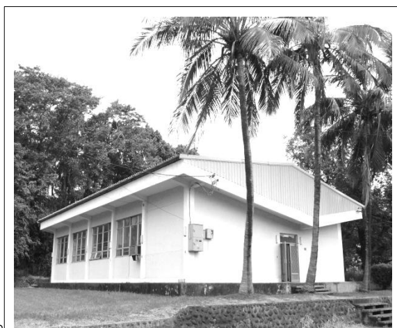
舊乳品加工廠外高高的可可椰子樹

本組舊乳品廠四周可可椰子樹每逢春天便結實纍纍，雖說椰子汁是清涼解渴的好飲料，可是要設法攀爬上這高高的椰子樹採下果實，卻不是容易之事，常常都是等到成熟時，椰子才會掉下來。通過這兒路人的運氣有三種，第一種恰巧可以接到椰子，解渴一番；第二種是椰子摔破，想喝也沒了；第三種則是日前發生的，椰子落果險些砸傷人。現在多是鼓勵人種樹，但碰上這種情形恐怕也得考量安全問題了。為此，本組亦向綠美化小組請教該如何處理，希望能在兼顧綠美化與行人安全上有個兩全之策。尚未處理好之前，在此特別提醒，大夥如果行經舊乳品廠，請先抬頭看看椰子果的動向，快步經過，安全為上。