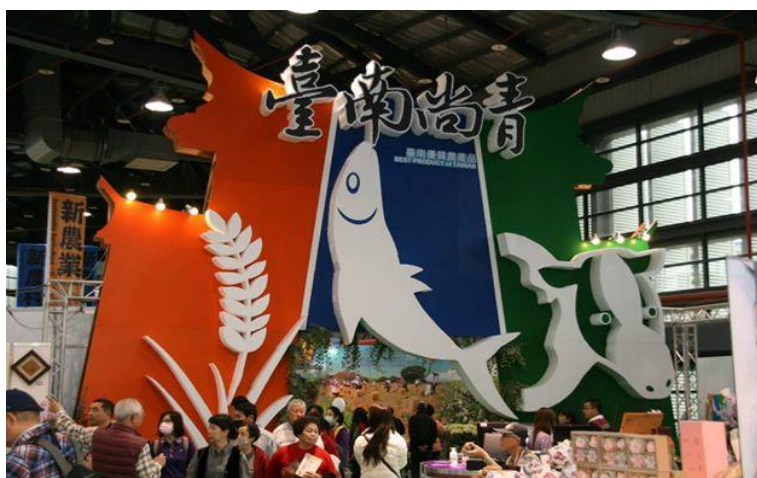
「臺南市農產品產地認證標章」-「臺南尚青」