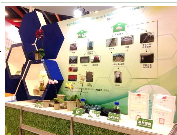
綠色農業體驗館 - “畜” 勢登場

本組於 3 月 13~16 日代表所內參與「2014 年國際綠色產品展 (EPIF)」，於農委會特設置之「綠色農業體驗館」展出污泥花盆、污泥膠布、牛糞活性炭、畜糞衍生燃料油、堆肥等畜牧污染防治新技術與禽畜糞再利用產品。本次展覽，主要透過 EPIF 讓更多人看到本所的綠色實力，近年因能源短缺、溫室效應之故，本所積極投入畜牧污染防治與廢棄物資源化、能源化之研究，研發出多項資源化之創新產品且取得發明專利，藉由此展呈現本所致力於環保節能減廢、因應氣候變遷、綠色科技與產品之努力與研發成果，且