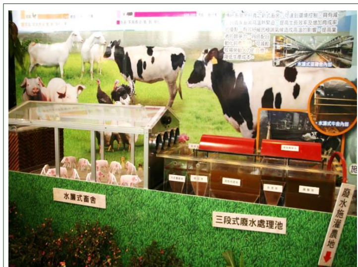
臺灣國際蘭展 - 農業館畜牧業展示攤位

傳達本所傾力於環境友善、綠色產業之用心，並尋求技術移轉的業者，合作推廣，帶領畜牧產業創造綠色商機。展覽期間學術研究單位、民間企業和民眾都爭相參觀及積極詢問研發技術與產品內涵，展覽大獲好評，展後並有廠商洽詢技術轉移事宜。