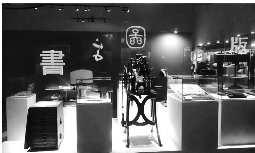
科工館訴心相印~印刷文物特展

除了志工經驗分享外，另一大重點就是參觀科工館環境相關議題特展。首先來到地下一樓「聽水的故事特展」，介紹東西方取水及儲水的方式、表面張力、連通管及虹吸等生活中經常遇到關於水的知識，最後氾濫與缺水的世界問題即讓參觀民眾思考水資源的有限與珍惜。接著來到氣候變遷展場，該展設計