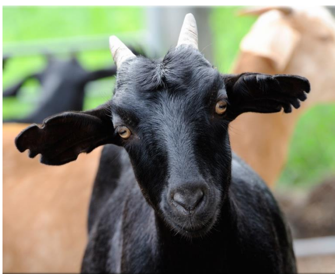
花蓮場內的吉安山羊

吉安山羊是花蓮場歷經十數個寒暑所選育而得的山羊品種，期間經過數任場長、多位退休同仁、莊主任和花蓮場同仁的努力，幾經波折後於 103 年 3 月 17 日公告核准命名。吉安山羊是由努比亞公羊和臺灣本土母黑羊雜交，選育出兼具臺灣黑山羊黑毛色、抗病、耐熱、耐粗食及母性佳等遺傳特性的肉用山羊。國人談到動物食補時，民間就有「一黑、二黃、三花、四白…」之說，故吉安山羊深受臺灣區域性消費者所喜愛。吉安山羊對環境耐