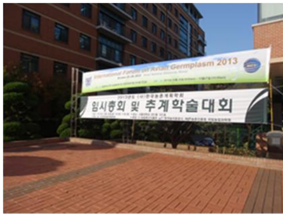
於首爾大學舉辦2013家禽種原會議

本屆家禽種原會議(Avian Germplasm 2013)於 10 月在韓國首爾熱烈展開，由韓國首爾大學 Dr. Han 帶領研究團隊主辦，3 天議程共計有 13 國、50 位研究學者參與為期三日之研討會，由該領域各國代表學者 37 人分別發表重要及新穎之研究成果。會議研討議題主要分為兩方面，一為家禽始基生殖細胞(PGCs)與胚盤細胞之研究，另為家禽遺傳物質冷凍保存。其中筆者亦發表雞隻始基生殖細胞體外培養前後轉錄體之研究，除初步提供在 PGCs 發育過程中潛在的關鍵分子機制外，同時也比較始基生殖細胞、基質細胞和胚成纖維細胞發育過程中基因調控的差異，可供研究 PGCs 發育的基因調控機制和探討雞性別發育之分子機制之參考。此次行程達成與國際交流之任務，未來本組會持續參與該會議，與各國研究學者進行交流，積極爭取國際家禽種原會議主辦權，以提升畜試所研究成果之國際知名度。