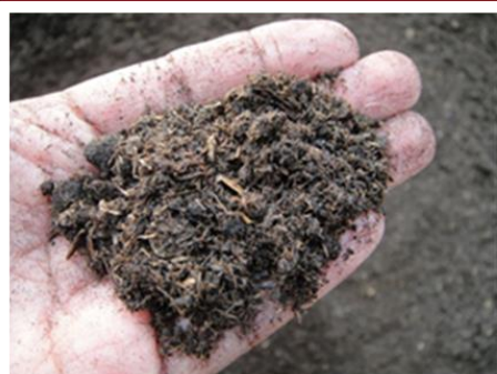
腐熟完全之牛糞堆肥

牛糞處理，本來是養牛業者頭痛的問題之一，本組一股與經營組合作下，先將收集的牛糞鋪平於堆肥舍，因牛糞含水量甚高約 85% 以上，待牛糞經風吹、日晒及人工翻堆等處理將含水量降低後，再將其用剷土機剷入堆肥舍的翻堆溝中進行曝氣與翻堆。牛糞剛移入翻堆時，因此時牛糞含水量仍高，且牛糞所含的有機物成分亦高，微生物在牛糞堆中充分利用其養分旺盛的繁殖並進行腐熟，過程中產生的熱(將水分變水蒸氣)及沼