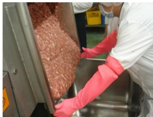
絞肉製程看見真功夫