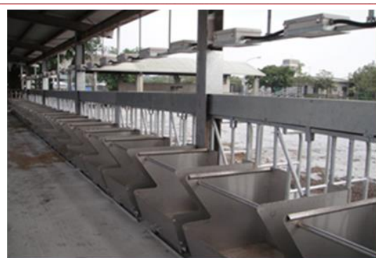
電子感應式柵欄與飼槽

本組一股為突破原來傳統試驗餵飼牛隻方式，將原來的餵飼柵欄改成電子感應式柵欄，使個別牛隻採食量更加精確，共有 24 座，柵欄上方設置無線射頻辨識系統(RFID)感應接受器，每頭牛隻頸部安裝一晶片感應器；另外每個柵欄有獨立的飼槽，飼槽下方設有磅秤，每個飼料槽之剩料重量即時顯示在中央螢幕上，亦可透過網路傳輸到管理者的電腦上。整套系統預擬的運作流程：