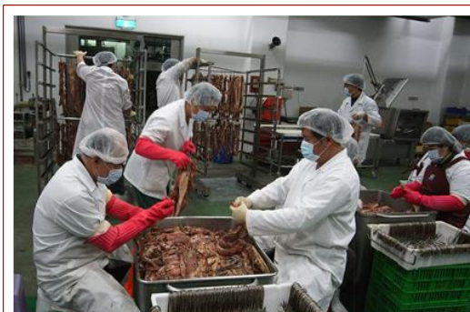
美味臘肉來自於獨門的調味配方