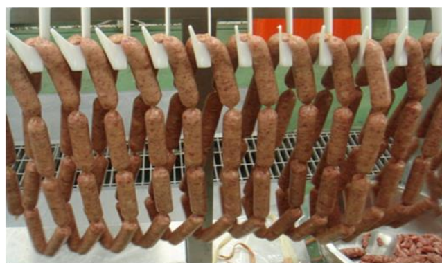
15噸的肉製品連接起來有101大樓這麼高吧！