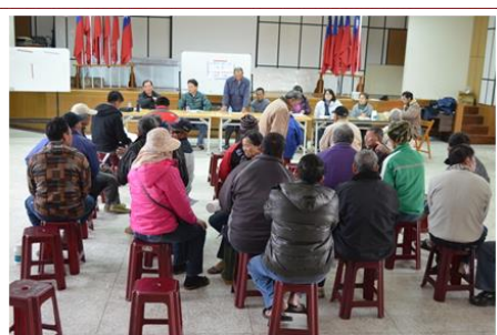
養牛班會議中進行熱烈討論

澎湖縣養牛產銷班於 12 月 19 日上午 10 時，假湖西鄉紅羅活動中心召開班會。本站、澎湖縣農漁局、縣農會、防治所及魏長源議員均受邀參加。會議開始先回應上次班會決議事項，包括牛隻屠宰專業人員，地磅設置與否(農漁局回覆)，女性獸醫師現場治療是否勝任(防治所回覆)，並進行口蹄疫防治宣導，現場提供驅蟲藥給農民領回使用。