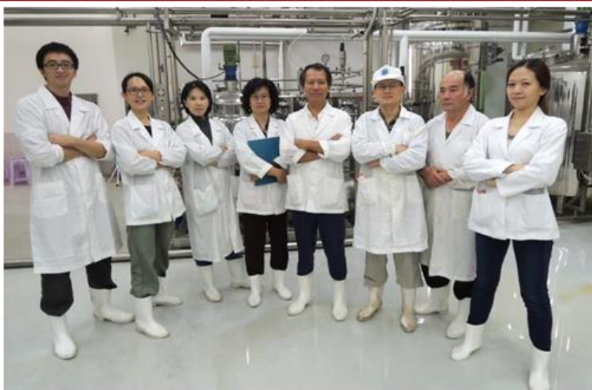
所訊新工作團隊請多多指教

12 月上旬召開了畜試所訊交接會議，會中除了感謝上一任技術服務組團隊編輯的辛苦外，也勉勵即將接棒的加工組與各業務單位的撰稿人繼續努力，以活潑生動的語詞呈現所訊的內容。會中問及有關所訊上網編輯的問題，才發現這個惱人的難題已經在技服組團隊的努力下克服了！