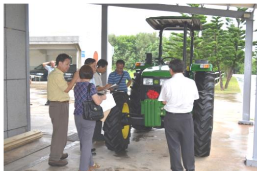
總所長官辦理驗收。