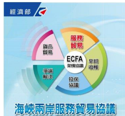
海峽兩岸服務貿易協議簡介LOGO

綜言之，兩岸服務貿易協議在農業方面僅開放「畜牧業顧問服務業」(排除家禽孵育及家畜禽配種服務)一項，而且是反映 98 年已開放的現況；本項協議並不涉及開放大陸農產品或勞工來臺，陸資來臺投資農產運銷及物流相關行業，將有助於我農產品銷售，對農民的收益將有幫助。