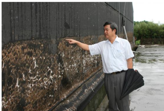
嘉文畜牧場受損情形

此外，舍內種鵝因受大水侵襲，導致鵝隻受到驚嚇，會造成種鵝產蛋率下降，如藉由控制舍內環境之穩定及種鵝之營養狀況，種母鵝將於 1-1.5 個月後，恢復其產蛋率。場區內外環境應儘速清潔恢復，限飼種鵝於此時亦需補充較多營養分，減少因大水所受緊迫及飢餓所造成傷亡，場區近期內需密集消毒，降低細菌滋生所造成之疫情。