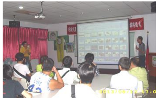
東海大學師生蒞臨本場

東海大學師生對本場的研發成果給予極度肯定，參訪的過程雖然短暫，但對於本場的工作性質已了然於胸，並對國內生醫用小型豬的科技發展、國際化的飼養管理與同仁的努力咸表欽佩。