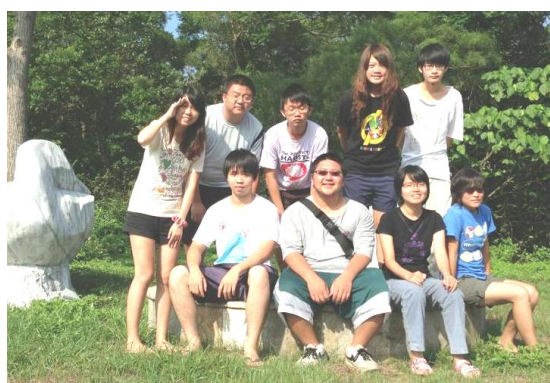
8 月份暑期實習生合影留念

才剛歡送順利完成期末報告的 7 月份實習生，8 月份的暑期實習生緊接著就來報到囉！本月份共有來自臺灣大學、文化大學、中興大學、東海大學及嘉義大學的 9 名熱血青年男女來所實習。雖然報到首日，同學看來較為安靜、拘謹，擔心他們無法適應彼此；但這份擔心顯然是多餘的，不到一週的時間，大伙就和樂地打成一片