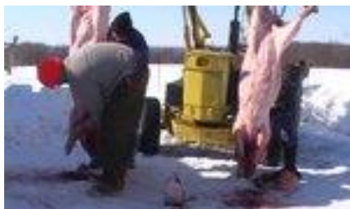
圖 6. 雪地屠宰，完全不用電