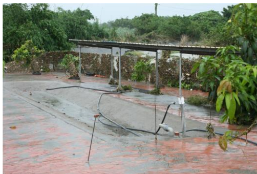
謝寶額畜牧場受損情形