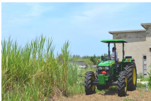
試車-新曳引機收割狼尾草