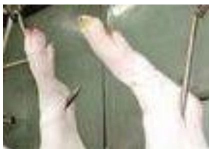
圖 4. 台灣一律掛在關節，傷到蹄膀的肉