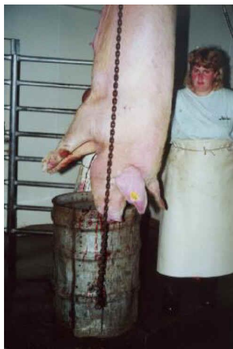
圖 5. 有衛生肉檢的「私宰」，懸掛用鐵鍊和滑輪，全部用人力

題目典出楚辭屈原卜居「黃鐘毀棄，瓦釜雷鳴。」筆者才薄，何敢自比黃鐘。但筆者於民國 53 年參加過聯合國在丹麥舉辦的屠宰場的策略、經營與肉品檢驗的講習，此後兩度在美進修，不但攻讀肉品的課，還深入了解屠宰場和肉品廠的作業，然而所提意見竟被棄而不用。筆者在 "Animal Industry in Denmark" (1964) 一篇報告中，就明白的指出幾點：(一)籌設屠宰場牽涉層面很多，應從社會面、政治面、經濟面、財務面、管理面、技術面、作業面分別加以考慮，並作可行性研究，一點馬乎不得。(二)新式公共屠宰場(電宰場)尚乏成功實例。丹麥曾資助泰國在曼谷興建現代化屠宰場一間，不久即歇業，機器棄置，場所淪為手宰之用；瓜地馬拉一屠宰場亦然，結果被一退役空軍將領租去經營肉品廠。正如我政府大力