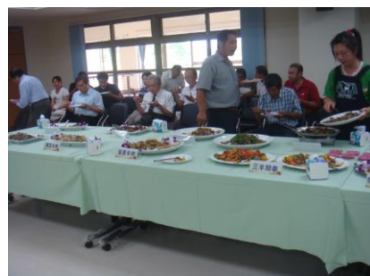
恆春黑羊羊肉品評會會場