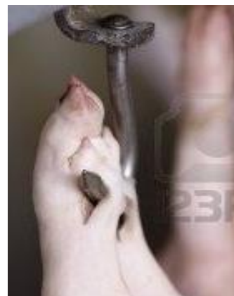
圖 2. 鉤掛穿孔部位應在關節前，割開皮膚，將鐵鉤勾住跟腱，不傷到肌肉