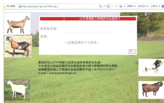
山羊 TMR 配方試算與營養評估系統首頁

目前台灣養羊產業面臨草料價格高漲，農民不斷尋求便宜的粗料供作羊之日糧，但往往不知改變物料時營養是否足夠？對成本實際能降多少？所以這套軟體提供最佳線性規劃模組，農民能輕鬆計算最低成本配方。在反芻動物營養之計算是一件重要的事，農民常因不黯數學運算，另外亦必須繁複的查詢營養需求表與原物料營養成分表，致生怯步然後黯然便宜行事，農民總認為動物吃飽就好，結果造成營養上的錯誤。在飼養