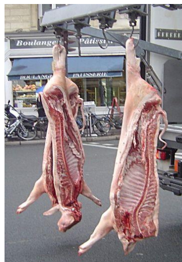
圖 1. 屠體懸掛

一、屠體鉤掛(gambrel)穿插點--歐美屠宰場一律在兩後蹄趾至關節之間的皮膚切開，將鉤掛一端插入，穿過跟腱(Achilles tendon, 台語腳跟)，另一端亦然(見圖 1, 2)。這樣就可靠跟腱將屠體懸掛起來。穿插點定於此處的理由，是皮下無肉，只有腱與骨(圖 3)，損傷最小。台畜學自高雄，而高雄當初自畜產試驗所拿來的木製鉤掛太粗不好用。改為鐵製又因所用鐵條太細，屠體掛上後，鉤掛下彎以致豬頭碰地，最後不曉得怎樣變成穿在下面的關節，該處蹄膀肉多，捅個大洞，屠體懸在鉤掛上，搖來搖去，洞邊的蹄膀肉破損污染，實在不能吃，是個損失。(見圖 4)