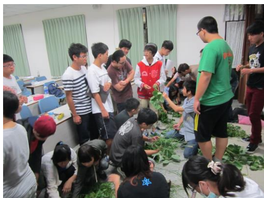
學員在教室裡討論各類牧草鑑別方法

班，以全國高中職學校三年級學生為主，平均年齡僅 17 歲，因應每年度農業類科學生技藝競賽而舉辦，由各校派員參加本所開辦的牧草種原鑑別訓練班進行加強集訓。