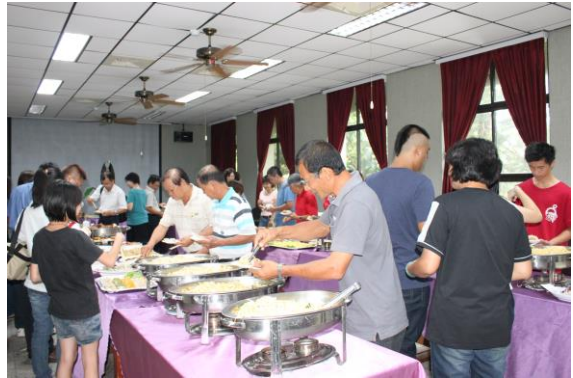
畜產品品嚐會熱鬧的宴會場景

活動當天總所長官、各分所、場同仁、屏科大老師、及相關業者蒞臨指導，並委請鄰近餐廳廚師以本場的高畜黑豬肉、紅羽土雞製作各式各樣的風味料理，現場更有現烤原汁原味的石板烤肉，此外，還有鹿茸特調雞尾酒及農家熱情贊助的藥膳鹿肉，讓大家可以一併品嚐，無形之中也展現在開放國際間各種肉品進口下的產品差異與區隔，對提升國內畜產業競爭力的優勢及嘉惠農民做努力。這場研討會不僅帶來許多新觀點，分享許多的產業概況，除具學術意義外，更重要的是在用心聽講之餘，美味的料理已喚醒大家的味蕾，在介紹完簡單的菜色之後，大夥都迫不及待地品嚐高畜黑豬、高畜土雞、藥膳鹿肉及鹿茸雞尾酒，呈現出這些畜產品的多元烹調特色，從大家滿足的神情中可以看出，料理的豐富美味，這次的活動可說是賓主盡歡，令人回味不已。