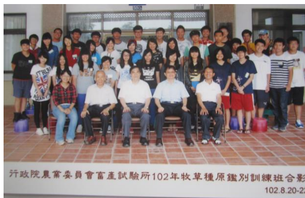
本屆牧草種原鑑別訓練班合影

每年由技術服務組主辦及本組協辦的牧草種原鑑別訓練班於 8 月 20 日開課，為期三天的課程，須讓學員充分瞭解牧草種原，除鑑別草種外，另安排畜牧政策及本所業務介紹、牧草多元化利用和國內牧草之生產及利用。本課程特別的是，學員為本所開設課程中平均年齡最小的一