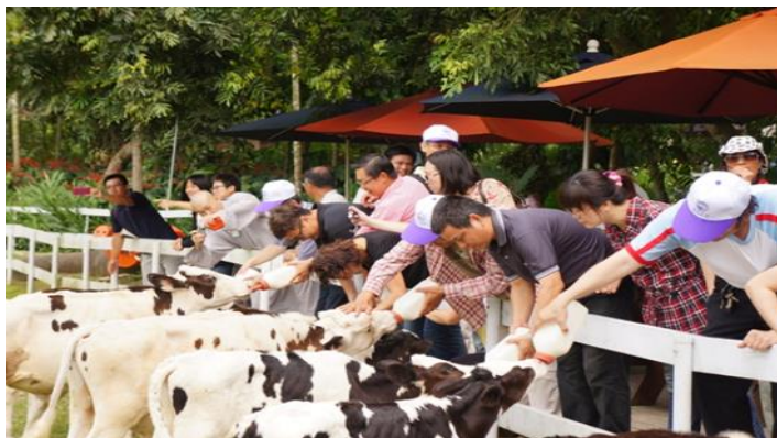
牧業入門班學員於綠盈牧場體驗餵小牛活動

為使牧業專業農民有終身學習的管道，同時也希望能讓社會大眾進一步認識畜牧產業；農民學院畜產訓練中心本年度規劃一系列的培育課程，從入門班、初階班、進階(選修)班到高階班共計 10 班，課程內容更全面性地涵蓋 8 項牧業產業(豬、牛、羊、雞、鴨、鵝、鹿、兔)，可說是傾聽農民的心聲，一次大大滿足農民的需求！以往本所大多將培訓能量灌注在專業農民身上，所規劃的訓練課程也多以技術性層面的動物飼養管理及繁殖相關課程為主。近年來從網路傳出有關畜產品的不實、怪謬消息不斷，實有必要讓國人了解畜牧產業生產概況以及經營