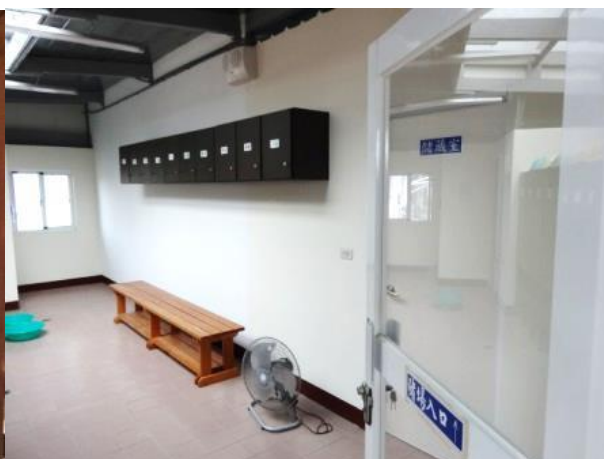
台東場現場更衣室