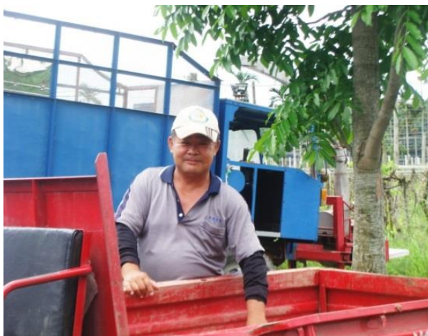
牛棚認真工作大帥哥

54 歲從不放棄求學決心，參加證照檢定考試，他全力以赴，毅力也讓人感動，印證只要肯努力就會有所收穫。他手上有 6 張證照，甲、乙級