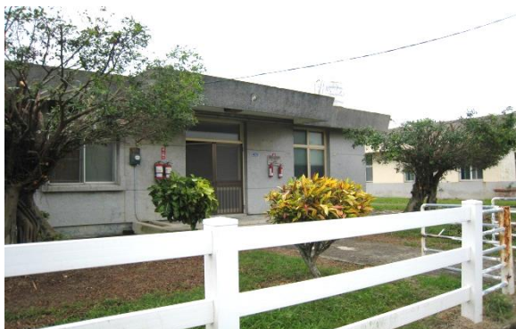
小動物室是早期的營養系系館