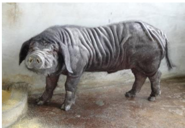
本地桃園豬的模樣