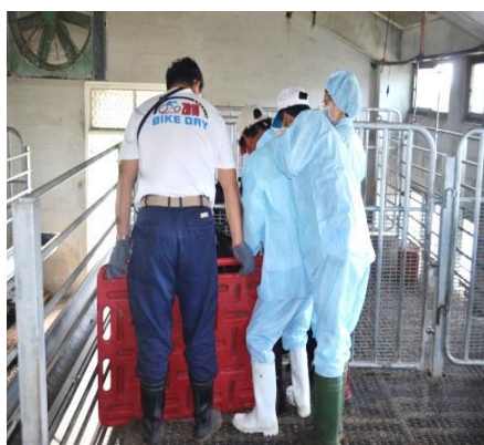
口蹄疫疫苗注射(羊)