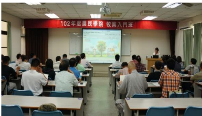
牧業入門班學員於教室上課情境

模式；因此，本年度特地規劃 2 梯次的牧業入門班，招收對象為一般社會大眾，目的是希望能藉由培訓課程讓國人了解畜牧產業，並進而了解產業可愛之處。第 1 梯次的牧業入門班已於 5 月 30 日結訓，本梯次不只報名踴躍(報名人數高達 50 名，只錄取 30 名)，學員反應也非常熱烈！第 2 梯次的課程也將於 8 月 6 日開課，忱致歡迎非從事畜牧產業的民眾踴躍報名參加！