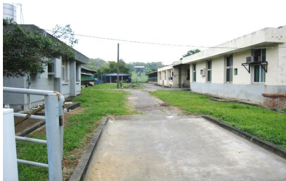
多年經營，試驗場區具有相當規模