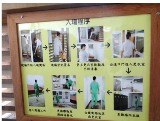
台東場現場入場程序圖