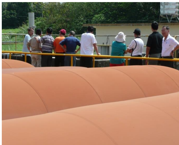
參訪廢水處理場運作情形