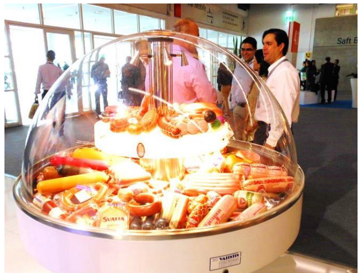
德國法蘭克福國際肉品展琳瑯滿目的肉製品