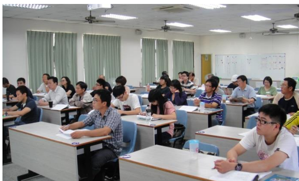
基因選種進階選修班學員上課情形

賣經驗分享：如何購買種豬、拍賣種豬，可說面面俱到。此課程報名學員有來自黑豬場負責人、種豬場年輕第二代、集團養豬育種幹部、動科所博士與高農教師等等，可說來頭不小，臥虎藏龍，講師群上課精湛生動，學員們上課也精神奕奕，課後學員與講師提出問題互相討論，同時感謝講師群對課程的講解，讓本次訓練班順利圓滿落幕。