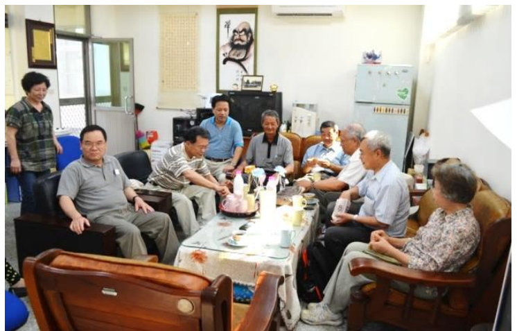
總所及退休長官來訪(6 對夫妻)

5 月 10 日上午有總所退休長官來訪，資深或已退休總所前輩夫妻檔共 6 對來澎湖遊覽時，順訪本站。長官夫婦們非首次遊澎，經驗老到的他們選擇比較不熱的五月天來玩，原本擔心連日的陰雨壞了遊興，恰巧在他們來訪這天開始連續出了幾天的太陽。老馬識途的長官們來站跟大夥話家常，並分享一些經驗，在稍作歇腳後，便開車繼續往南遊歷，謝謝他們的傳承，也歡迎大家蒞澎時來站參訪。