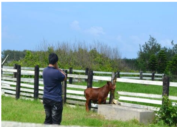
吹箭-口蹄疫疫苗注射(牛)