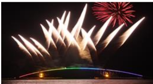
澎湖海上花火節(轉錄自官網)

今年有什麼特別的嗎?除了活動延長了一個月外，去年底澎湖縣以「台灣澎湖海灣」名義加入「世界最美麗海灣」的國際組織，因此今年活動主軸為「最美麗海灣、最炫麗花火」，於 4 月 18 日至 6 月 24 日 盛大登場。要特別注意的是