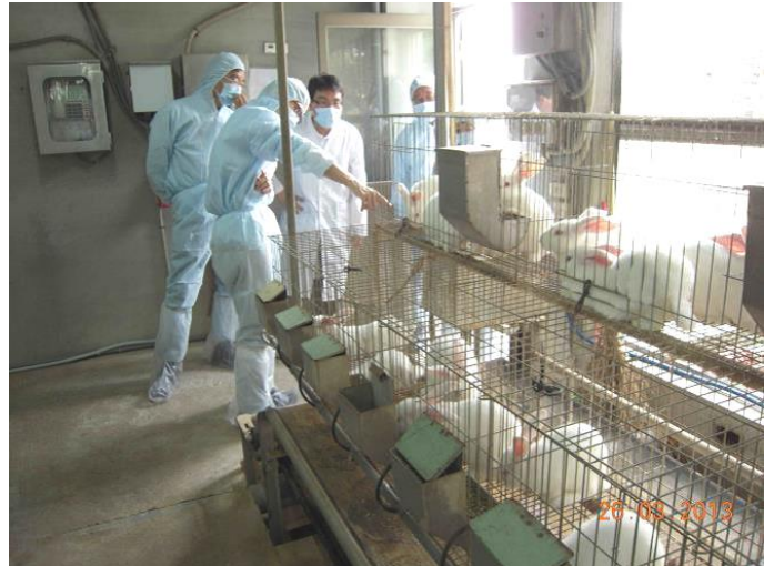
輔導委員現場查核