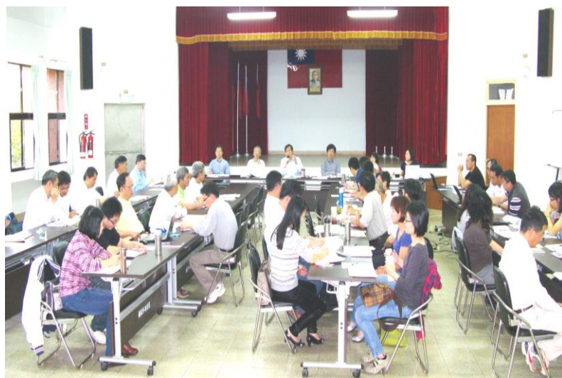
畜產改良作業基金概算籌編研商會議

本所畜產改良作業基金 103 年度概算籌編研商會議，於 3 月 13 日假本所行政館三樓大會議室舉辦。本會議係針對作業基金之業務收支、產銷目標、固定資產之建設改良擴充及資金運用等項目進行討論。因本所作業基金屬業權型特種基金，其預算之編製應本企業化經營原則，設法提高產銷營運量，增加收入，抑減成本費用，提高經營績效，以追求最高賸餘為目標，因此概算之籌編更應覈實與審慎。