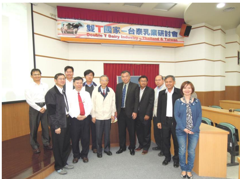
泰國畜牧局沈局長(右五)率團與本所同仁合影

泰方代表演講介紹泰國乳業發展，其中令人印象深刻的是泰國全年氣候炎熱，進口的荷蘭乳牛年產約4千公斤，經過與泰國本地