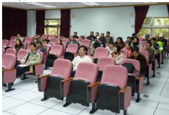
員工座談會同仁參加情形