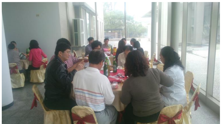
年終加工品製作完後聚餐

過年加工肉製品製作一直是本所加工組的傳統與特色，同仁經兩個月的辛勞才完成此一任務。大家辛苦工作一段時間，年終聚餐時特別有感觸。目前加工品與多年前比較，數量與種類已經增加許多，但是人力卻未相對增加，加工組的同仁卻只能默默承受增加工作負荷，人力的運用幾乎是技工與外包全數動員。隨著現場工作人員年齡增加與屆齡退休技工，未來應該是調整的時機，畢竟試驗研究單位還是應將工作重心放於研究事務。