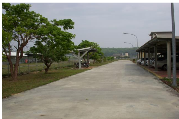
產三股保持整潔的環境