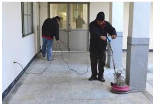
辦公室年終大掃除