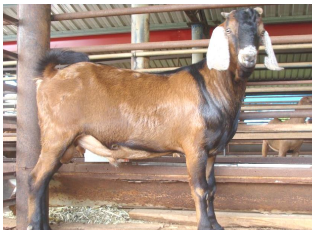
高體重仔羊 7 月齡的英姿