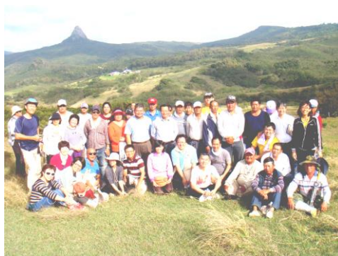
恆春分所健行活動全體員工合照

繼團拜結束後，大夥兒移師大圓山牧區，這是開春最夯的健行活動，沿途可見自然災害對牧區環境的衝擊，以及水土保持區為牧路邊坡所做的水保工程，經由現場體驗達到環境教育的目的。由於長假之後相見歡，大家一路上談笑風生，似乎把煩惱暫拋九霄雲外，沿途風光很美麗，空氣很清香，視野愈高愈遼闊，印證古詩“欲窮千里目，更上一層樓”的境界，有了芬多精的洗禮，每人都神清氣爽，開心合影留念。