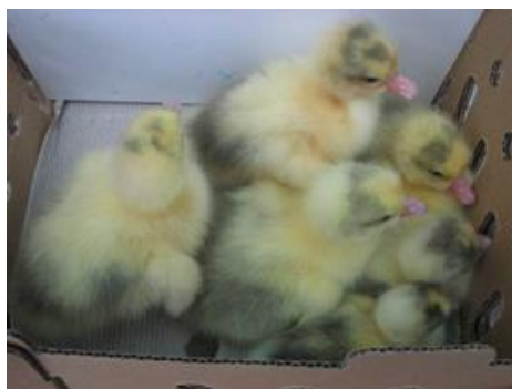
北斗雛鵝行銷花蓮裝箱運送

花蓮長久以來對外建立了「好山好水好環境」的形象，農民走向品牌概念及做出市場差異性的觀念，從「產地到餐桌」，是一條充滿故事與用心的食物生產旅程，建立口碑及提高產品附加價值，在競爭的市場中益形重要。