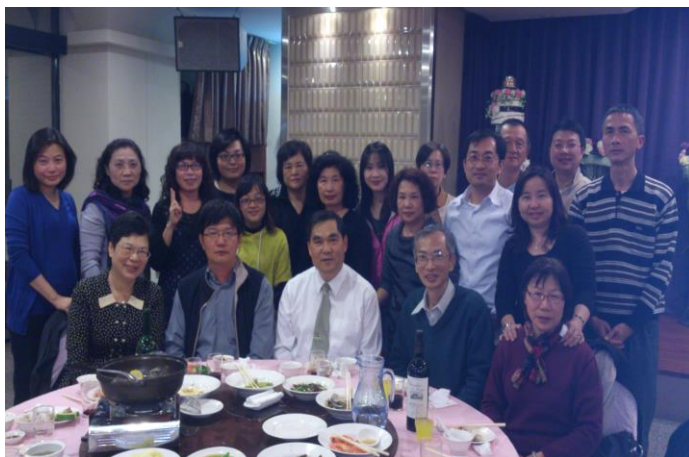
主計室與人事室同仁合影

轉眼間又是歲末年終了，此時的主計工作不僅是要就整個年度經費之執行情形提出決算報告，緊接著又要為次一年度之預算進行編列之準備工作，因此這段期間可說是主計室之非常時期。雖然處在忙碌的氣氛中，但一聽到主任要作東請同仁們年終聚餐時，大家可都興高采烈地討論起聚餐地點，最後選定於台南大飯店孔雀廳用餐，為的是可任意品嚐其主題餐點—府城食選之各式台灣小吃。