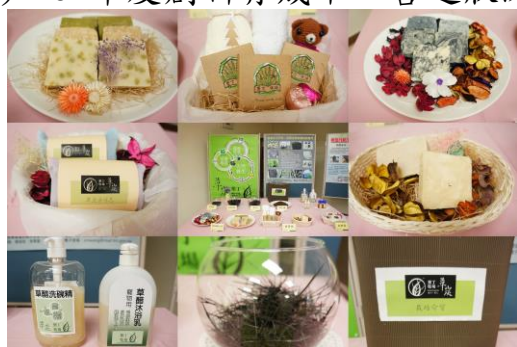
「牧草多元利用-牧草生物炭開發與應用」主題現場展示品縮影圖