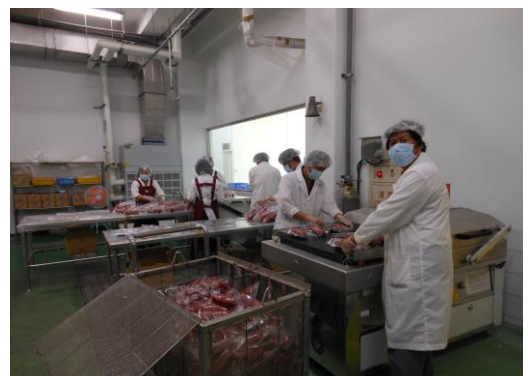
過年加工肉製品製作

過年加工肉製品一直是本所的特色產品，配方與製程經過數十年來前輩的改良與傳承，才有今日最適當的口味與口感。加上新的設備，本組一直在力求改變與突破，唯一不變的是堅持良好品質與口味。多年努力得到同仁的信賴，加工產品雖未大力推廣，但是看到每年同仁訂購數量，實在令人嘆為觀止。因此加工組同仁必須在假日出勤才有辦法如期完成如此大量的生產量，目前雖有限制購買數量，