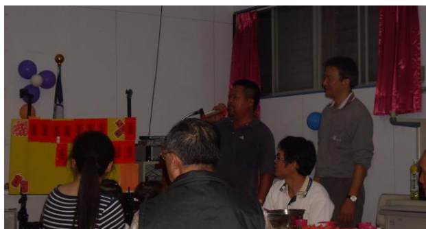
有朋自遠方來不亦樂乎