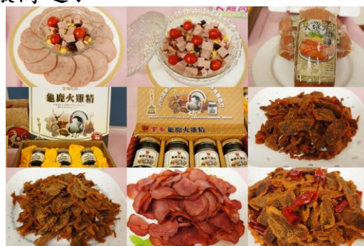
「發燒新品-新出爐的健康禽肉加工產品」主題現場展示品縮影圖